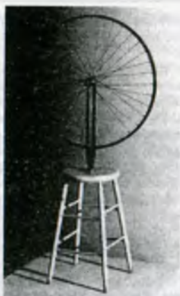
Рисунок – «Фонтан» Марсель Дюшан