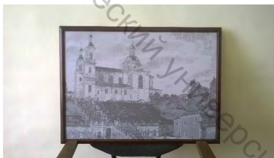
Рисунок 3 – Нарботанный образец ткани, оформленный в виде тканой картины

Основным направлением в этой работе является разработка нового ассортимента тканей с использованием действующих заправочных станков на работающих предприятиях с последующей их выработкой. Это позволяет расширить возможности дизайна жаккардовых тканей и формировать новый сектор рынка, связанной с сувенирной текстильной продукцией. Кроме того, в настоящее время в дизайне интерьерных тканей востребованы рисунки с имитацией трехмерности, а выполнение таких рисунков возможно только с