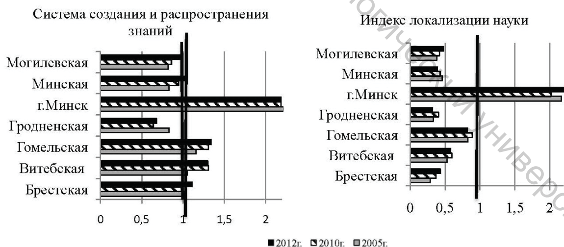
Рисунок 1 – Оценка уровня развития системы создания и распространения знаний и индекса локализации науки по регионам Республики Беларусь за 2005–2012 гг.