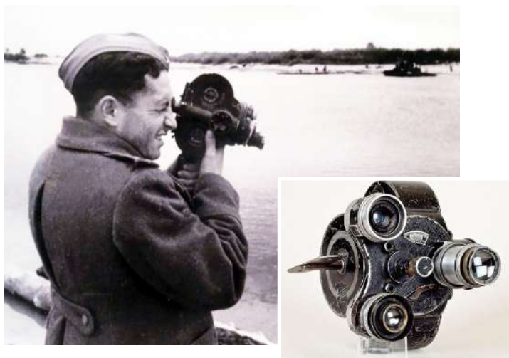
Рисунок 26 – Ручная камера «Аймо»