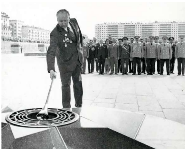
Рисунок 34 – Первый секретарь Витебского обкома КПБ С. Шабашов зажигает Вечный огонь в монументе Три штыка на площади Победы в Витебске.