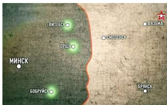
Рисунок 3 – Кадр из фильма «Неизвестные сражения Великой Отечественной. Витебск». 2020. Обозначение главных точек обороны 1944 года

Вторая битва за Витебск. 13 декабря 1943 года части 11-й гвардейской и 4-й ударной армий подошли от станции Городок к озеру Лосвидо под Витебском. Короткометражный фильм «Военная тайна озера Лосвидо» (2013) является прологом к исследуемому нами фильму.