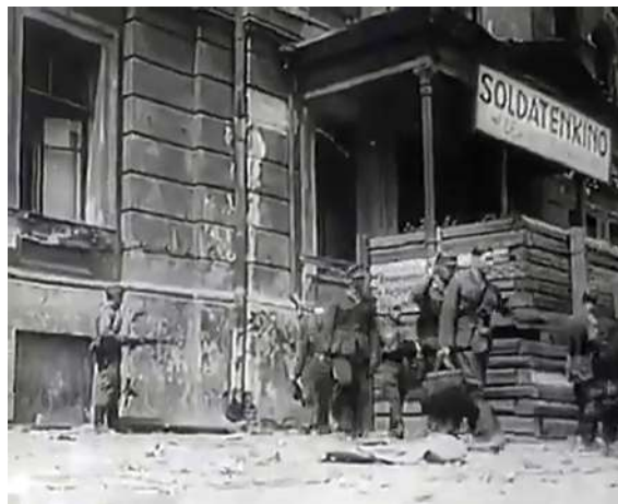
Рисунок 13 – Кадры из фильма «Сражение за Витебск» 1944. Здание Окружного суда и вывод немецких пленных из солдатского кино, устроенного в этом здании в 1942 г.