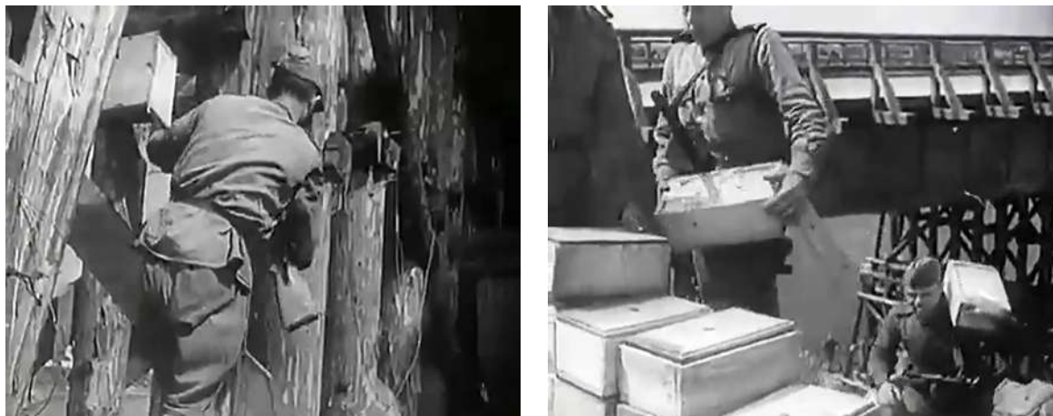
Рисунок 16 – Кадры из фильма «Сражение за Витебск» 1944. Разминирование и спасение моста в Витебске бойцами взвода Ф. Блохина

они были отбиты. Только на рассвете на помощь Блохину подошли бойцы батальона капитана Казанцева. Саперы извлекли из моста около 2 т взрывчатки (рис. 16).