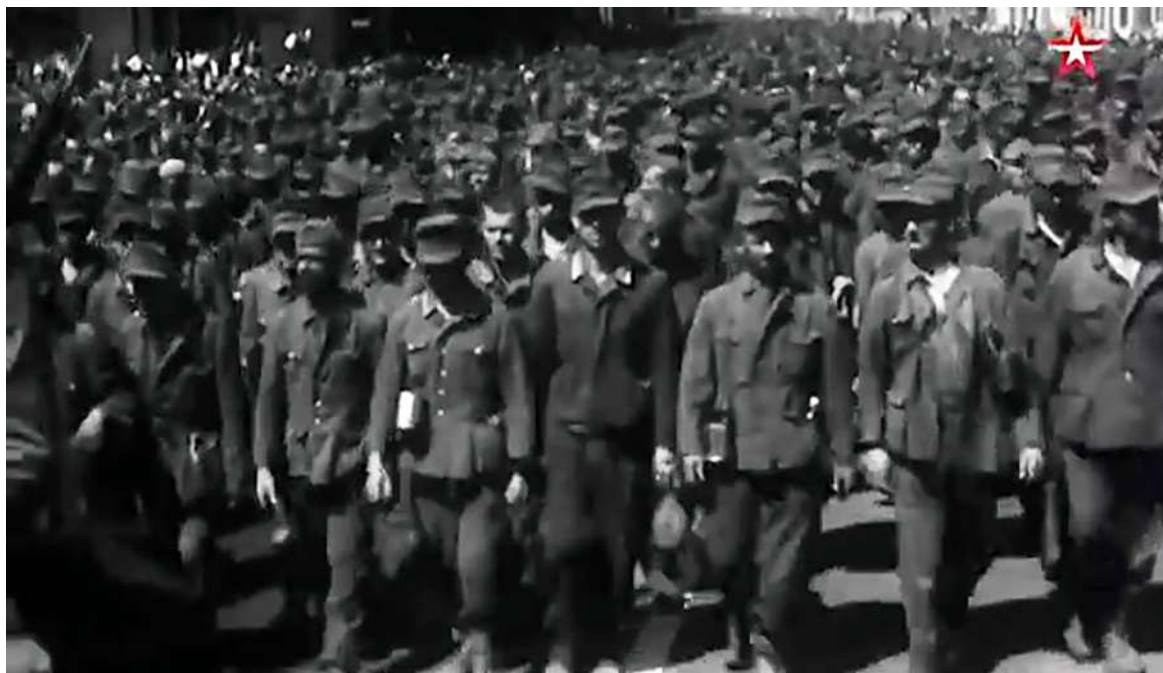
Рисунок 8 – Кадр из фильма «Неизвестные сражения Великой Отечественной. Витебск». 2020. Марш побежденных 17 июля 1944. Москва

В финал картины «Неизвестные сражения Великой Отечественной. Витебск» включен эпизод «Марш побежденных» (рис. 8), который прошел в Москве 17 июля 1944 года. 57 тысяч оборванных немцев, все те, кто оказался в витебском котле в июне, шли в голове колонны пленных по проспектам Москвы, куда они так стремились к ноябрю 1941-го.