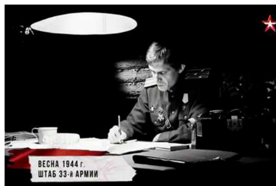
Рисунок 4 – Кадр из фильма «Неизвестные сражения Великой Отечественной. Витебск». 2020.