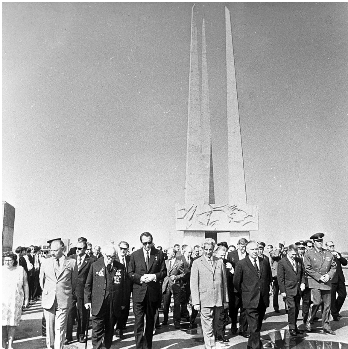
Рисунок 37 – З. Азгур, П. Машеров, В. Михельсон на площади Победы в Витебске 30 августа 1974 г.