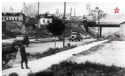
Рисунок 7 – Кадр из фильма «Неизвестные сражения Великой Отечественной. Витебск». 2020.