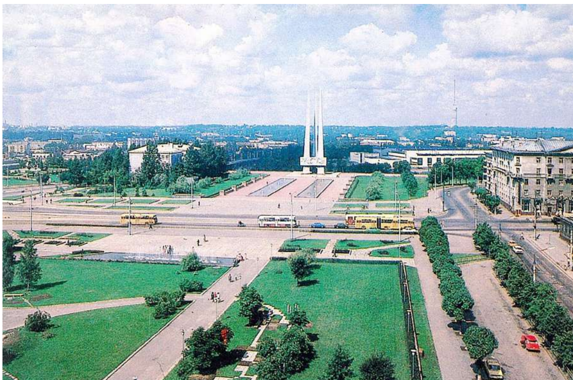
Рисунок 30 – Площадь Победы в Витебске. 1974 г.

Решением горисполкома от 27 декабря 1973 года «площадь, прилегающая к пр. Черняховского» стала именоваться Площадь Победы . Торжественное открытие площади и монумента «Три штыка» состоялось 30 июня 1974 года. Монумент расположен в западной части площади, в зоне некрополя, и закатное, уходящее в воды Западной Двины солнце, окрашивает его и фонтаны Материнских слез перед ним в багровые цвета (рис. 30–31).