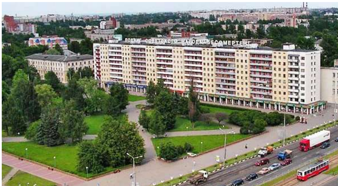
Рисунок 32 – Сквер на восточной стороне площади Победы

Первый секретарь обкома КПБ С. Шабашов, председатель облисполкома П. Рубис, бывший командующий 39-й армией Герой Советского Союза генерал-полковник И. Людников, представители воинских частей, освобождавших область открыли памятник и зажгли Вечный Огонь на площади Победы в Витебске (рис. 33–34)[3, л. 22–28].