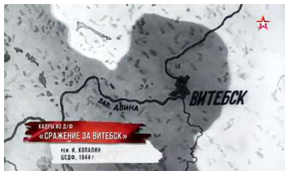
Рисунок 9 – Кадр из фильма «Сражение за Витебск» 1944