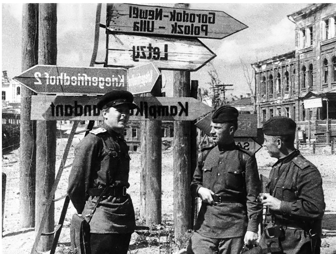
Рисунок 28 – А. Твардовский в Витебске на площади Свободы. 1944 г.

также за поэмы «Василий Тёркин» и «Дом у дороги» подполковника Твардовского наградили орденом Отечественной войны 2-й степени.