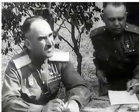
Рисунок 17 – Кадр из фильма «Сражение за Витебск» 1944. Генерал И. Людников допрашивает пленных немецких генералов