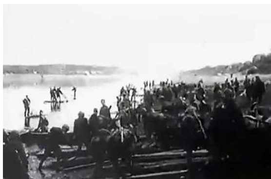
Рисунок 10 – Кадр из фильма «Сражение за Витебск». 1944. Форсирование Западной Двины войсками 1 Прибалтийского фронта

Фильм начинается кадрами движения 1 Прибалтийского фронта, это – форсирование Западной Двины с северо-запада от Витебска, съемки боев на подступах и окраинах, в самом городе, в его центре (рис. 10–12).