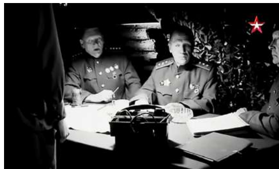
Рисунок 6 – Кадры из фильма «Неизвестные сражения Великой Отечественной. Витебск». 2020. Совещание у генерала Соколовского.