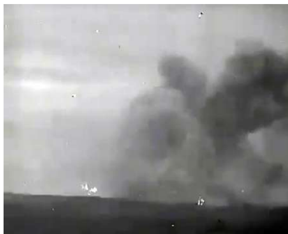
Рисунок 12 – Бои на подступах к Витебску