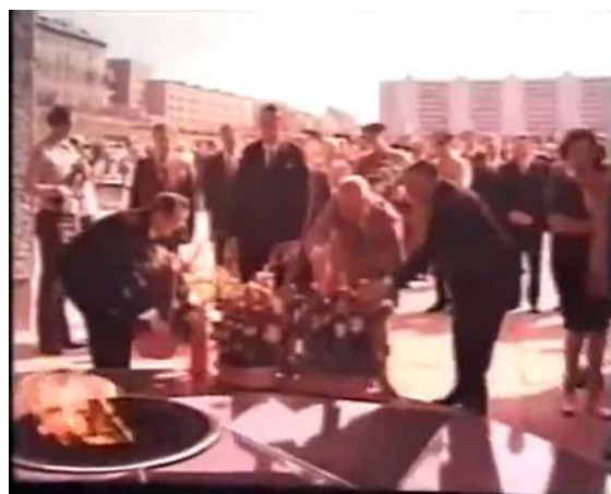
Рисунок 36 – П. М. Машеров, первый секретарь ЦК КПБ возлагает цветы к Вечному огню на площади Победы в Витебске. 1974 г.

Живая память о событиях июня 1944 года осталась в кинолентах, не ушла исключительно на архивные полки, а воспроизводится снова и снова.