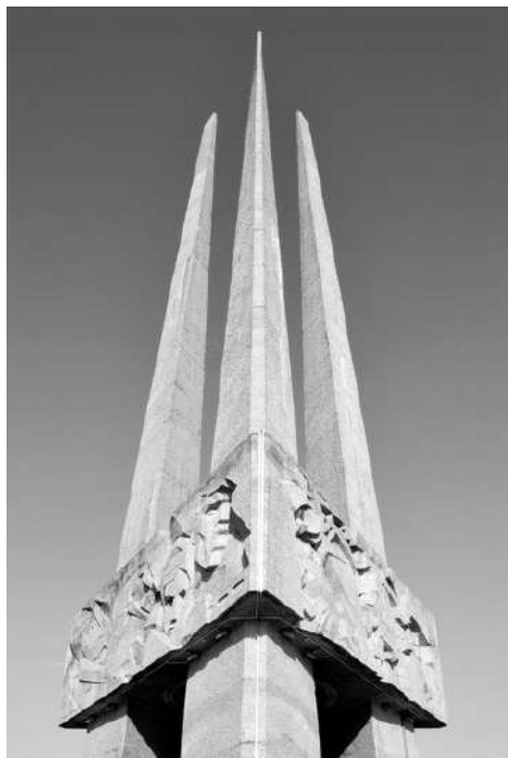
Рисунок 31 – Монумент «Три штыка» со скульптурным фризом/поясом

Сквер на восточной стороне площади Победы – символ торжества Жизни с редкими породами деревьев (рис. 32), привезенных ветеранами со всего Советского Союза в честь каждого погибшего в Витебской области в годы войны.