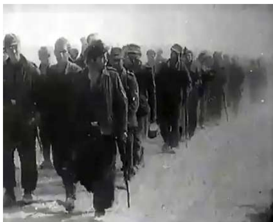
Рисунок 18 – Кадр из фильма «Сражение за Витебск» 1944. Колонны пленных немецких солдат