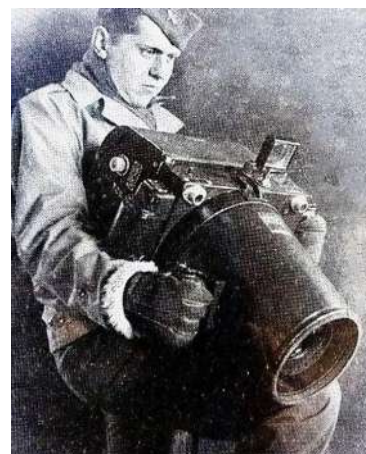
Рисунок 27 – Камера для съемки в полёте