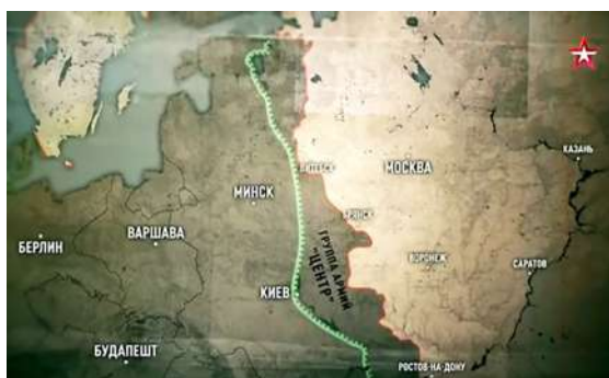
Рисунок 2 – Кадр из фильма «Неизвестные сражения Великой Отечественной. Витебск». 2020. Линия обороны «Восточный вал» 1943–1944 гг.