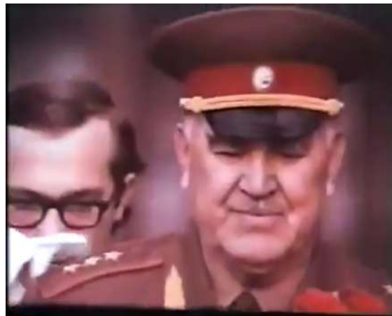
Рисунок 35 – Генерал армии И. Людников возлагает цветы к Вечному огню на площади Победы в Витебске. 1974