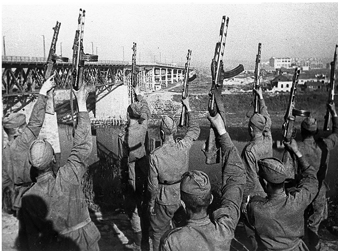
Рисунок 19 – Солдаты в Витебске салютуют в честь взятия города