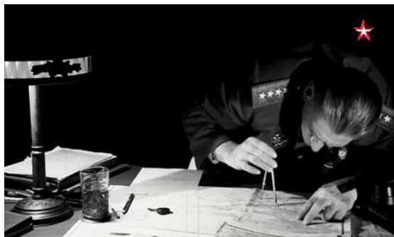
Рисунок 5 – Кадры из фильма «Неизвестные сражения Великой Отечественной. Витебск». 2020. Генерал Соколовский за картой в своем кабинете