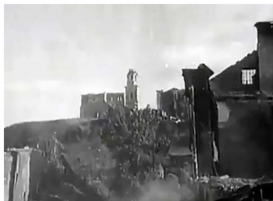
Рисунок 11 – Кадры из фильма «Сражение за Витебск» 1944 г. Бои на окраинах Витебска и в городе

В ленте показаны встреча витеблянами бойцов советской армии, пленение немецких солдат – особо выделены кадры вывода их из здания солдатского кино (здание Окружного