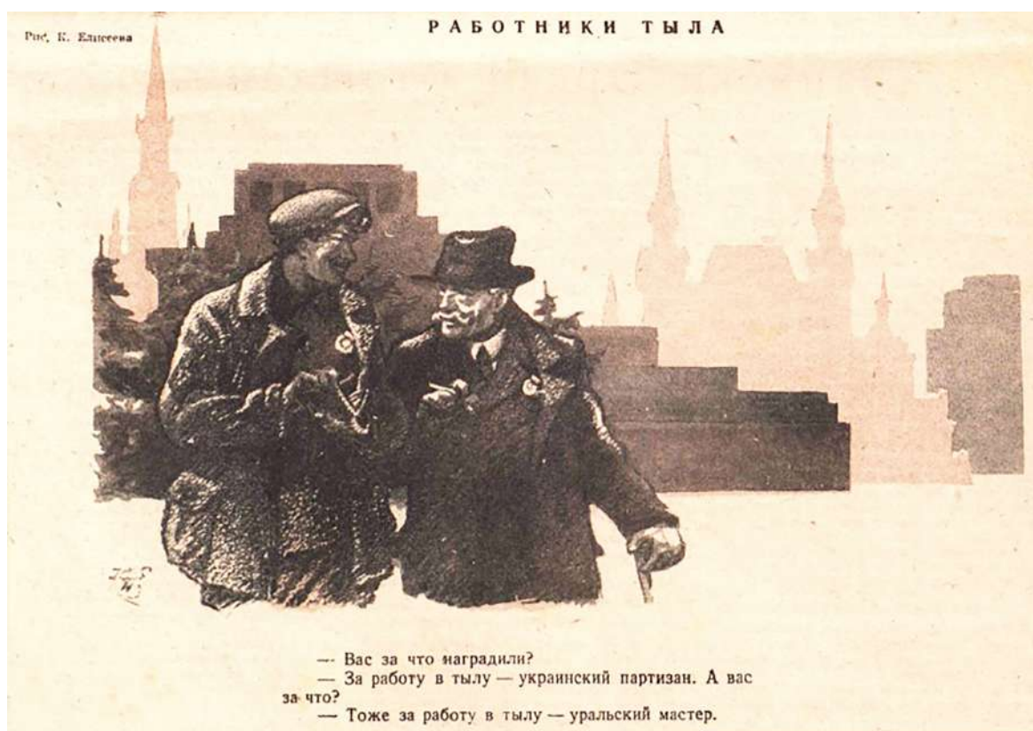
Рисунок 2 – Работники тыла. К. Елисеев [3]

Труд в тылу является частью боевых действий. Следующий рисунок К. Елисеева «Работники тыла» в выпуске № 38-39 1943 г. развивает эту мысль. На иллюстрации представлена сцена диалога между двумя героями – украинским партизаном и уральским мастером (рис. 2.). Оба награждены за свои заслуги, что указывает на равнозначность их вклада в победу. Фон – силуэт Кремля – символизирует общегосударственный характер борьбы, объединяющий усилия всех граждан страны. Рисунок передает идею уважения к каждому участнику войны, независимо от их роли. Мастерство художника выражено в деталях: выражения лиц, позы и одежда подчеркивают простоту и искренность героев, а текст усиливает общий посыл. Символический диалог подчёркивает равнозначность вклада партизан и тыловиков в общую победу. Украинский партизан, сражавшийся с врагом на оккупированной территории, и уральский мастер, трудившийся на заводе, выполняли одну миссию – обеспечить победу над врагом. Они олицетворяют единство фронта и тыла, где каждый герой – на своём месте, будь то поле боя или цех завода.