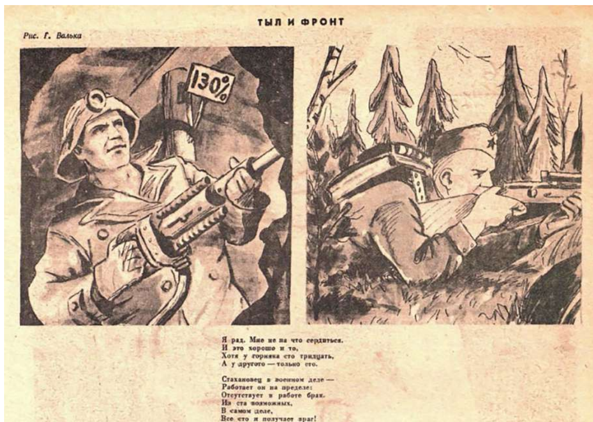
Рисунок 1 – Тыл и фронт. Г. Вальк [3]

Стахановец в военном деле – Работает он на пределе: Отсутствует в работе брак. Из ста возможных, В самом деле, Все сто и получает враг!»