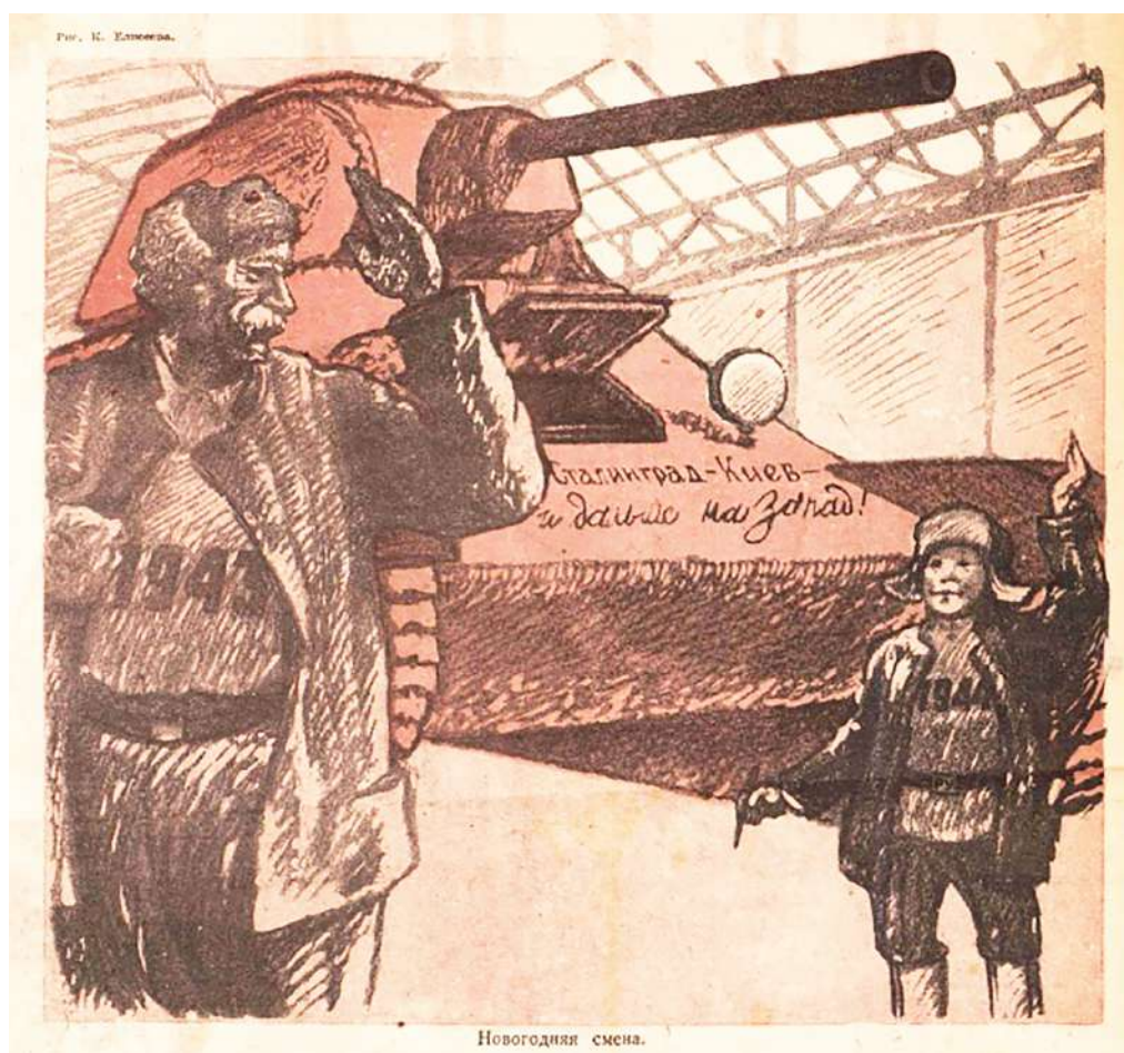
Рисунок 4 – Новогодняя смена. К. Елисеев [3]

Далее тема преемственности поколений и общей борьбы за победу отражается в рисунке К. Елисеева в выпуске № 48. 1943 г. В центре композиции – пожилой рабочий и мальчик, которые, находясь на фоне танка. Пожилой мужчина отдает воинское приветствие, а мальчик с энтузиазмом поднимает руку, выражая готовность к труду и продолжению традиций старшего поколения (рис. 4). Стоит обратить внимание, что мальчик на рисунке совсем юный: это говорит о том, что в тылу трудились все, кто мог держать в руках инструмент, включая детей, которые стояли у станков, работали в полях и помогали взрослым выполнять сверхнормы. Подпись на танке «Сталинград – Киев – и дальше на Запад!» подчеркивает связь трудового фронта с осуществившимися военными победами, символизируя поддержку фронта заводами, производящими военную технику. Надпись под рисунком «Новогодняя смена» намекает на то, что трудовой подвиг продолжался даже в праздничные дни, а преемственность поколений и готовность работать ради Победы стала центральной идеей.