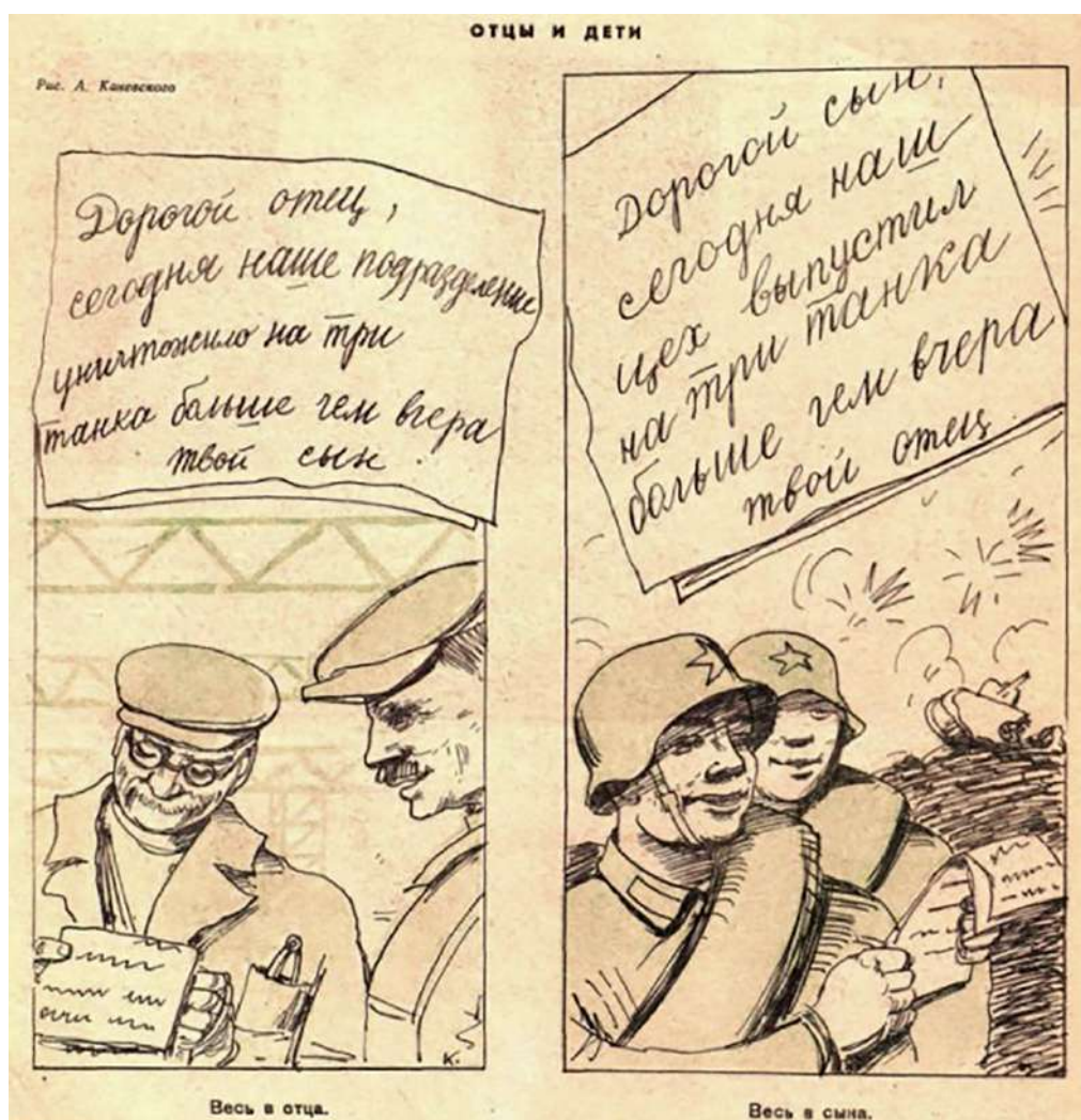
Рисунок 5 – Отцы и дети. А. Каневский [3]

Если предыдущий рисунок иллюстрирует передачу опыта и ответственность старшего поколения за воспитание смены, то следующий – совместные усилия отцов и детей в достижении общей цели. На рисунке А. Каневского, озаглавленном «Отцы и дети» в выпуске № 14 за июль 1941 года, представлены две части: слева изображён рабочий-отец, который читает письмо сына с передовой: «Дорогой отец, сегодня наше подразделение уничтожило на три танка больше, чем вчера. Твой сын». На заднем плане виден цех завода, что подчёркивает его принадлежность к трудовому фронту. Справа изображён солдат-сын, читающий письмо отца с завода: «Дорогой сын, сегодня наш цех выпустил на три танка больше, чем вчера. Твой отец». И на заднем плане виднеется поле боя с танками и взрывами. Подпись «Весь в отца» и «Весь в сына» подчёркивает связь между поколениями, их общее стремление превзойти результаты прошлого дня (рис. 5).