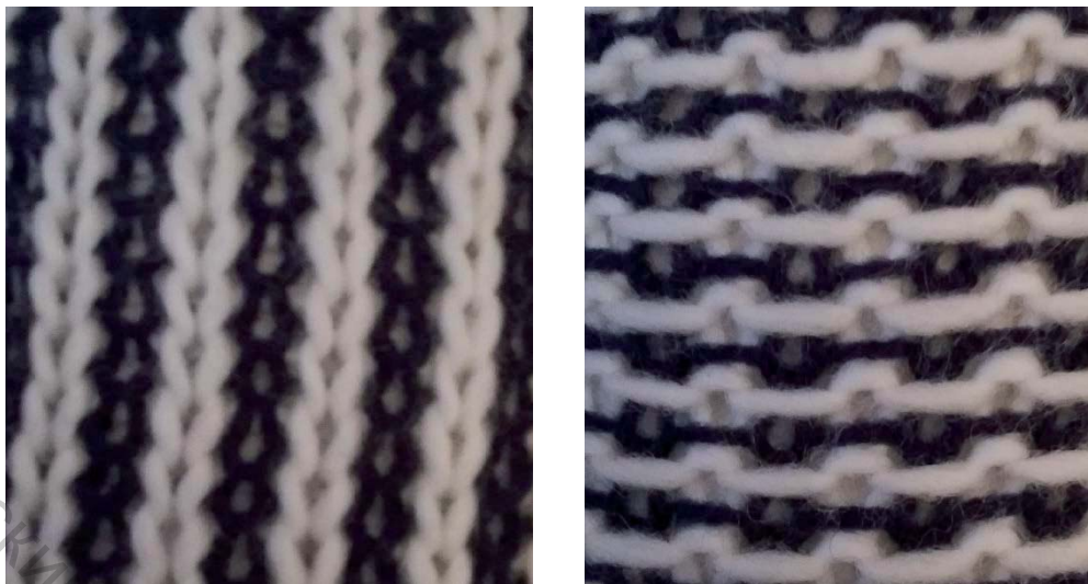
Рис. 2 - Фотографии лицевой и изнаночной сторон трикотажа

При этом протяжки соединяющие остоны и лицевых и изнаночных петельных столбиков располагаются с одной стороны трикотажного полотна. Остоны петель лицевых и изнаночных петельных столбиков такого трикотажа заходят друг за друга, образуя один петельный слой, в котором противоположные изгибы нитей в остонах петель уравновешивают друг друга. Таким образом, данная структура двухслойного трикотажа представляет собой незакручивающиеся одинарное кулирное переплетение, значительно меньшей материалоемкости по сравнению с другими аналогичными двухслойными переплетениями.