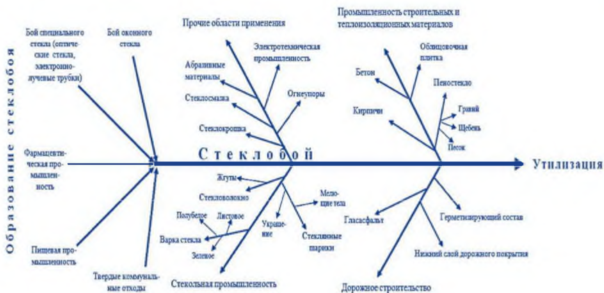
Рисунок 1 – Схема направлений использования боя стекла Figure 1 – Water absorption of samples with the addition of broken glass

Для получения стеклогранулята стеклобой измельчают в дробилке, отделяют фракцию 1–5 мм, так как стеклобой такой фракции не используется стеклотарными заводами. Металлические, керамические включения, этикетки отделяют в процессе переработки стекла в стеклогранулят. Температурный интервал спекания 860–960 °С соответствует технологическим параметрам двухъярусной туннельной печи. В работе (Павлушкина и Кисиленко, 2011) рассмотрены вопросы образования стеклобоя как в виде твердых бытовых отходов, так и на предприятиях промпереработки листового стекла. В работе показана перспектива использования стеклобоя при изготовлении материалов различного назначения. Декоративные облицовочные материалы – стеклокремнезит, стеклокерамит, прессованные плитки и смальта могут быть получены широкой цветовой гаммы, разной конфигурации и размеров.