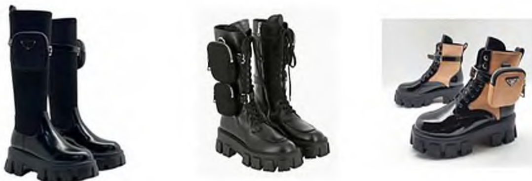
Рисунок 4 – Обувь с ремнями под мини-сумки от Prada

Помимо летних вариантов, дизайнеры выводят на показы и зимнюю обувь с ремнями, и даже с мини-сумками, крепящимися на голенище высокой обуви. Изначально подобная ременная обвязка обуви появилась у байкеров, ведь она помогала предотвратить истирание и ожоги обуви от горячих элементов мотоцикла [2]. Но этот тренд как достаточно эстетичный и практичный был позаимствован в обувь обычных людей. А мини-сумки на обуви, не только тренд последних сезонов, но ещё и достаточно практичны. Ведь в них можно сложить мелкие вещи и, например, отказаться от сумки (рис. 4).