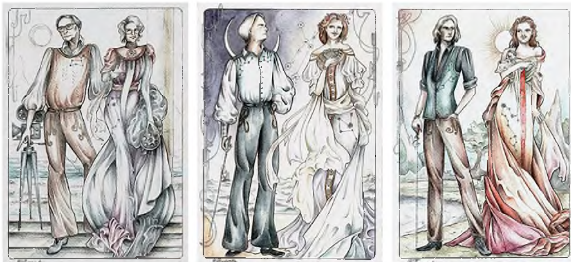
Рисунок 2 – Фрагмент эскизного ряда сценических костюмов для звёзд российского кино, разработанный в стилистике ар-нуво под влиянием творчества Альфонса Мухи