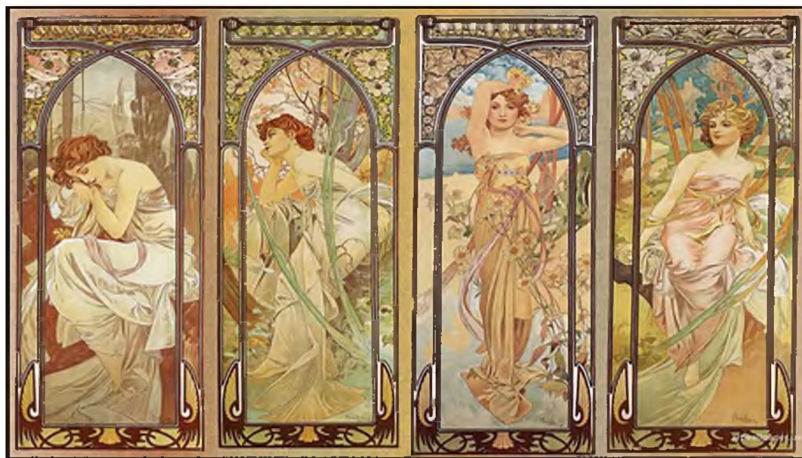
Рисунок 1 – Альфонс Муха. Четыре времени суток [2]

литография, и в настоящее время его произведения в этой технике находятся в коллекциях многих известных музеев и галерей мира. Характерными чертами стиля арт-нуво и творчества Альфонса Мухи стали идеализированные и стилизованные образы прекрасных женщин, которые органично вписывались в орнаментальную систему из цветов, листьев и символов. Его «поющая линия» и изысканный колорит открывают его собственный стиль – единственный и неповторимый (рис. 1).