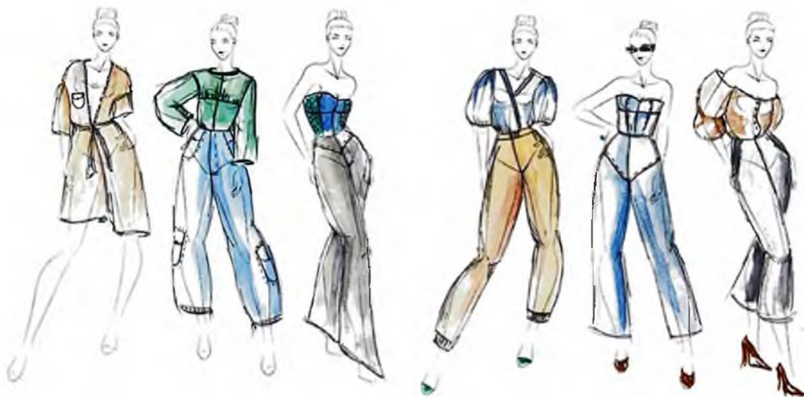
Рисунок 4 – Фрагмент эскизного ряда авторской коллекции «Кэжуал унисекс». Автор – Черныш Варвара

На основании проведенного ретроспективного анализа одежды в стиле «кэжуал» была сформирована концепция авторской коллекции «Кэжуал унисекс» [7, 8]. Коллекция в стиле «кэжуал унисекс» сочетает в себе свободу и удобство для современного человека. Коллекция предназначена для девушек, женщин, которые ценят комфорт в одежде, не теряя при этом элегантности [9]. Данная аудитория выбрана, потому что, женщины являются наиболее требовательными к своему внешнему виду, к качеству тканей, пошиву. На базе полученных в результате анализа данных, спрогнозированы перспективные модели полуприлегающего и свободного силуэта. Материалы – смесовые, практичные, износостойкие ткани в сочетании с денимом, фурнитура из натуральных пород, таких как бамбук, дерево (рис. 4).