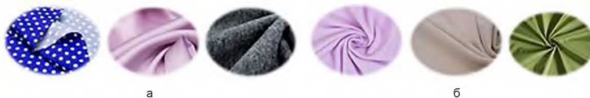
Рисунок 3 – Популярные материалы: а – первой половины 20 века – хлопок, шелк, шерсть; б – второй половины 20 века – флис, кашкорсе, дюспо

К 1990 годам химическая промышленность в области производства тканей вышла на существенно новый уровень. Текстильный ассортимент пополнили бифлекс, микрофибра, флис, дюспо, сатен и многие другие материалы. Ткани также отвечали необходимым требованиям, при этом имели относительно небольшую стоимость. Эти материалы стали носить круглогодично. На рисунке 3 б представлены материалы популярные в начале 1990-х годов [6].