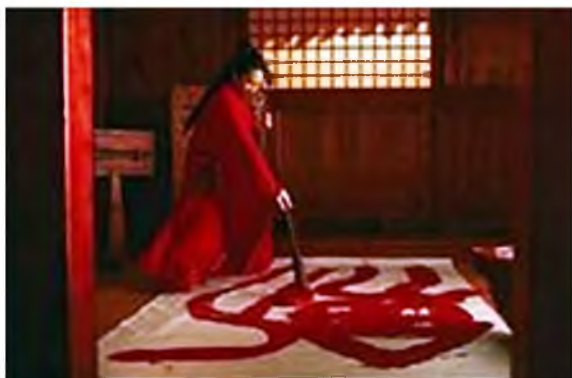
Рисунок 1 – Кадр из фильма «Герой»: работа над иероглифом