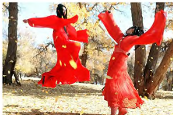
Рисунок 2 – Кадр из фильма «Герой»: боевой танец двух девушек

В драме Чжана Имоу «Подними красный фонарь» (1991) многие оттенки красного буквально пронизывают фильм, обогащая его слои нюансами и контекстом. Картина рассказывает историю юной девушки, которая после смерти отца была вынуждена оставить своё обучение в университете и стать четвертой женой состоятельного феодала. Чжан Имоу использует чистый алый в интерьерах, костюмах и в главном символе фильма – фонарях. В традиционной китайской культуре красные фонари символизируют торжество и благополучие, однако в этом фильме они приобретают иную семантику – беды, интриги и господства. Красный становится цветом тревоги для женщин. Несмотря на то, что вначале мы видим главную героиню в красных свадебных одеждах, которые должны олицетворять грядущее счастье, атмосфера фильма удушающая и создает ощущение пустоты и страха (рис. 3).