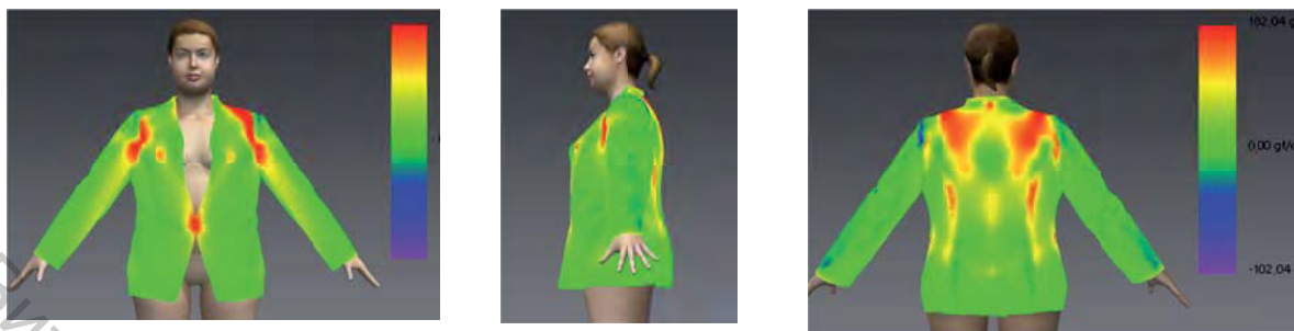
Рисунок 6 – Фотографическое изображение карты напряжения и давления жакета из х/б ткани на манекене – 164-120-126

По выявленным недостаткам созданы рекомендации по корректировке конструкции для устранения дефектов и для улучшения гармоничности восприятия жакета во всех размерах.