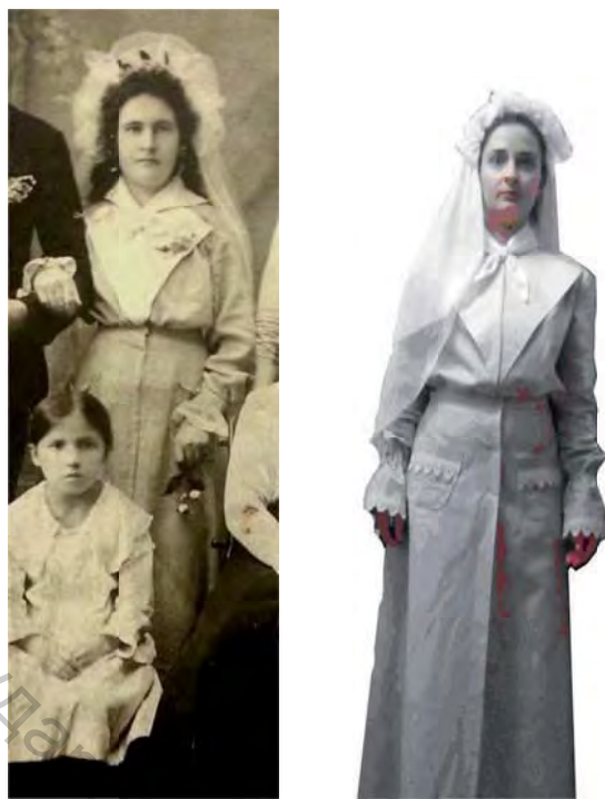
Рисунок 3 – Сравнительный анализ модели-оригинала (а) и реконструируемой модели (б)

В процессе работы были изучены методы и средства воссоздания силуэтной формы исторического костюма; получены параметрические данные, характеризующие объемно-силуэтную форму и особенности конструктивного решения плечевого и поясного изделий, составляющих свадебный женский комплект 1914 года; освоены способы адаптации исторического кроя к графике чертежей конструкции одежды, построенных по современным методикам; приобретены навыки использования забытых приемов и способов изготовления исторических видов одежды и техники изготовления элементов исторического декора костюма начала XX века.