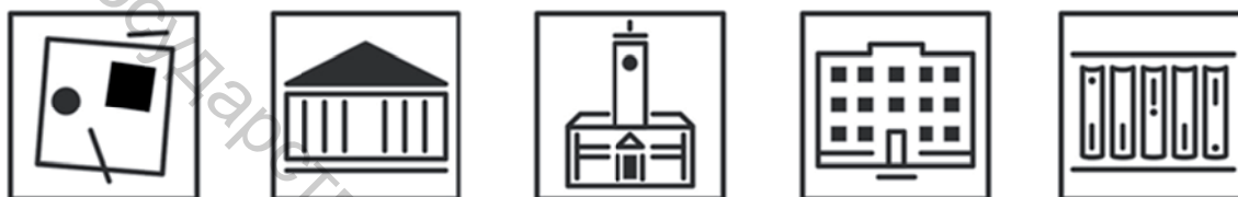
Рисунок 2 – Визуализация иконок для сайта раздел «Общество, культура, информация»

Конструктивный характер иконок продиктован культурно-историческими ценностями Витебска и обликом города, позволяющими сделать «Зеленую карту Витебска» оригинальной и неповторимой, а обобщенность форм и структура иконок легко вписываются в существующую карту-основу сайта, для которой необходима четкая визуализация, ясность и быстрота считывания всех пиктограмм.