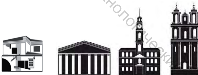
Рисунок 1 – Визуализация архитектурных памятников Витебска в стиле конструктивизма

Витебск как родина Марка Шагала и УНОВИСа получил известность во всем мире. Декоративная печатная карта «Витебск – общество, культура, информация» должна подчеркнуть образ города как культурной столицы Беларуси с уникальной историей и традициями авангарда. Пиктограммы для декоративной карты будут носить уникальный индивидуальный характер на основе архитектуры и авторской интерпретации (рисунк 3). Предполагается на карте сделать панорамные виды Витебска на основе значимых памятников архитектуры и истории, яркую цветовую гамму для создания сильного стильного образа и эмоционального эффекта.