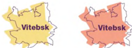
Рисунок 1 – Первый вариант логотипа

Проработано несколько вариантов логотипа города. В первом варианте (рис. 1) получает развитие идея с очертаниями карты города. Контур заливается сплошной заливкой и на заднем плане создает контраст форм.