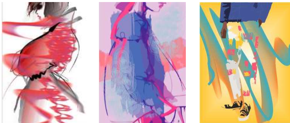
Рисунок 1 – Эффект размытия: авторы-Путро А.С., Клапкова Н.Н.

- превалирующий цвет (монохромное решение, контрастные сочетания, тонкие градации оттенков серого, включение яркого цветового акцента в черно-белую композицию);