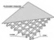
Рисунок 1 – Структура ткани с полимерным покрытием (экокожа)

Экокожа представляет собой композиты, образованные сочетанием двух слоев. Структура ткани с полимерным покрытием представлена на рис. 1.