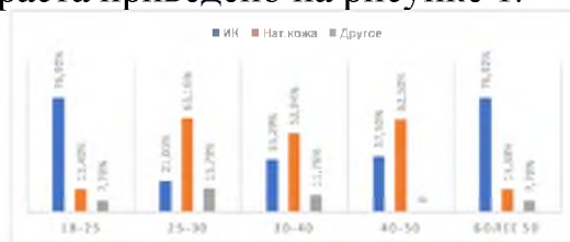
Рисунок 1 – Распределение предпочтений покупателей в выборе обуви

27,1% принявших участие предпочитают обувь из кожи, 21,4% – из искусственной кожи, также встречались ответы, что «предпочитают обувь из замши; кожаную, замшевую; из ткани; полиуретана; лаковую; Flywire». Распределение предпочтений покупателей в выборе обуви из кожи или ИК в зависимости от возраста приведено на рисунке 1.