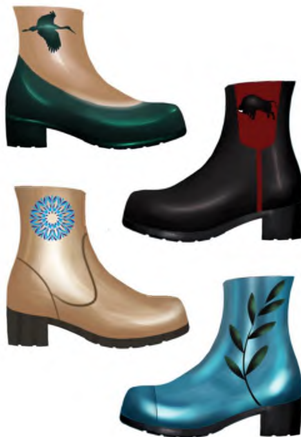
Рисунок 3 – Эскизы моделей коллекции женской обуви

популярности. Также она играет важную практическую роль, обеспечивая стопе дополнительное пространство для комфорта при длительной носке (рис.3).