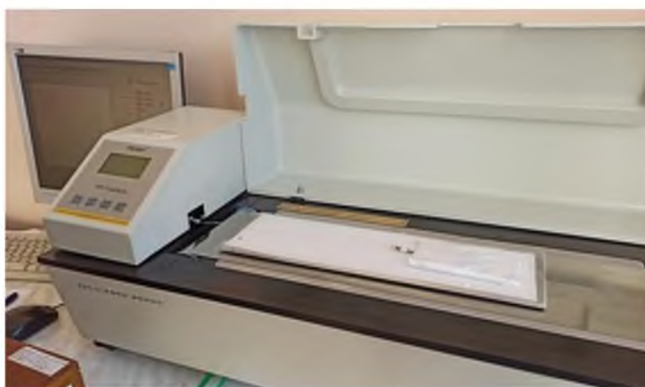
Рисунок 2. Прибор FPT-F1

Из изученных авторами приборов наиболее пригодным для измерения КТС текстильных полотен является прибор для измерения трения/отслаивания Labthink FPT-F1 (см. рис. 2), который имеется в аккредитованной Центральной заводской лаборатории ОАО «Витебскдрев». Прибор оснащен тензодачиком, с помощью которого снимаются показания силы трения. Электродвигатель обеспечивает движение несущей плоскости с постоянной скоростью. Технические характеристики прибора позволяют тестировать образцы на скоростях от 50 до 500 мм/мин. Значение силы регистрируется автоматически.