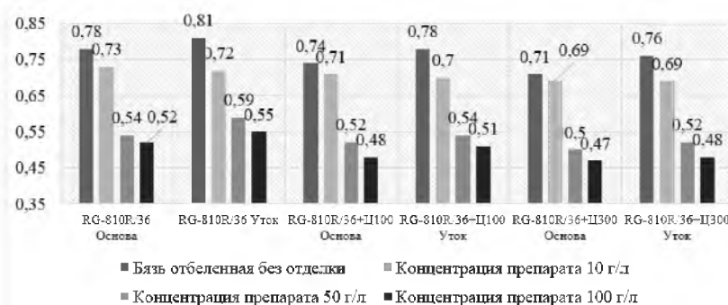
Рисунок 3. Статический КТС хлопчатобумажной ткани

Авторами была проведена апробация разработанной методики на обработанных образцах хлопчатобумажной ткани высокоэффективными ферментосодержащими композициями белорусского производства при различных концентрациях препарата. На рисунках 3 и 4 представлена оценка статического и кинетического коэффициента тангенциального сопротивления хлопчатобумажной ткани.