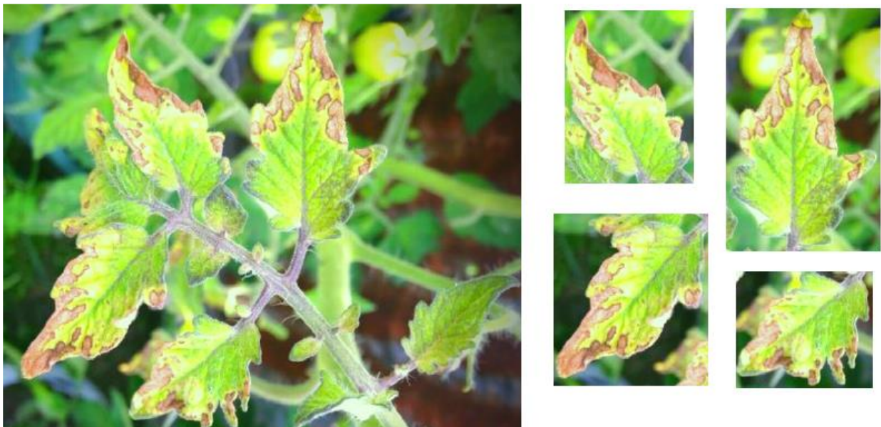
Рис. 1. Пример нарезки исходного изображения из набора данных PlantDoc на несколько, содержащих только одну листовую пластину

Результаты и их обсуждение. Работа посвящена выявлению и распознаванию болезней, поражающих растения томатов. Томат был выбран для изучения, т.к. он является экономически важной овощной культурой во всем мире. Рассмотрено 6 видов наиболее распространенных заболеваний томата, поэтому данные разделены на 7 классов (седьмой класс – это здоровые растения). Количество изображений, соответствующее каждому классу в наборах данных PVD и C-PD, представлено в табл. 1. Каждому заболеванию присущи характерные признаки, показанные на рис. 2.