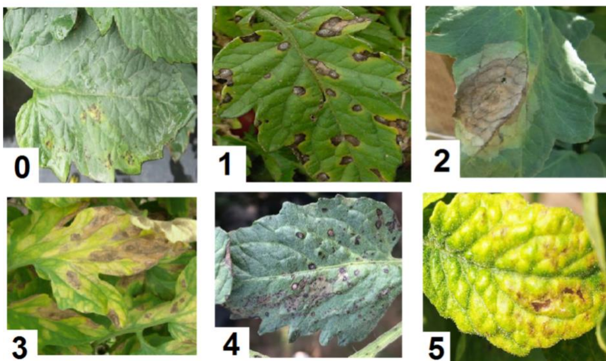
Рис. 2. Внешние признаки, характерные для каждого класса заболевания (0 – Tomato Bacterial spot, 1 – Tomato Early blight, 2 – Tomato Late blight, 3 – Tomato Leaf Mold, 4 – Tomato Septoria leaf spot, 5 – Tomato Yellow Leaf Curl Virus)

Все рассматриваемые модели CNN, обученные на наборе данных PlantVillage, при последующем тестировании на нем, продемонстрировали хороший результат (Accuracy 95% и выше). Из результатов (табл. 2), полученных при тестировании на наборе данных Cropped-PlantDoc, можно сделать вывод, что сети, обученные только на PlantVillage, в реальных полевых условиях показывают себя значительно хуже. Модель дает неточные результаты из-за фонового шума, не строго ориентированного расположения листа, его деформаций и прочих факторов, вызванных внешними условиями (погода, неравномерная освещенность листа) или низким качеством фото.