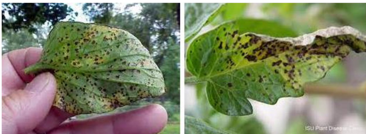
Рис. 3. Листы томата с заболеваниями Bacterial spot и Septoria leaf spot

При визуальном осмотре пораженных листьев растений у специалиста могут возникнуть затруднения при схожести внешних признаков заболевания. Например, схожесть симптомов при заболеваниях Bacterial spot и Septoria leaf spot продемонстрирована на рис. 3.