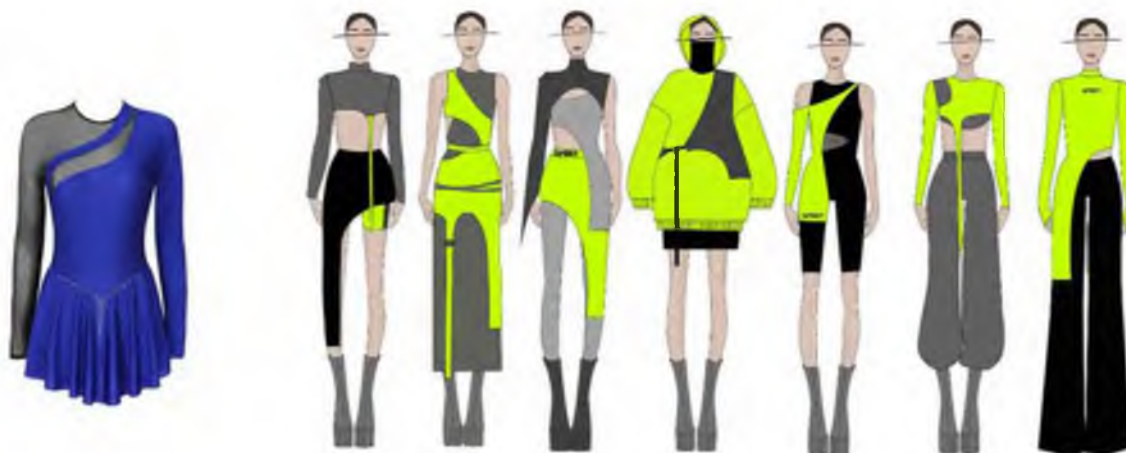
Рисунок 2 – Специфика кроя авторских моделей согласно референсу

Анализ членений полочек и спинок купальных изделий показал разнообразие пластических очертаний, конфигураций деталей кроя, что и стало аналогом при создании авторской коллекции женской одежды из трикотажных полотен под девизом PHYSICAL (рис. 2).