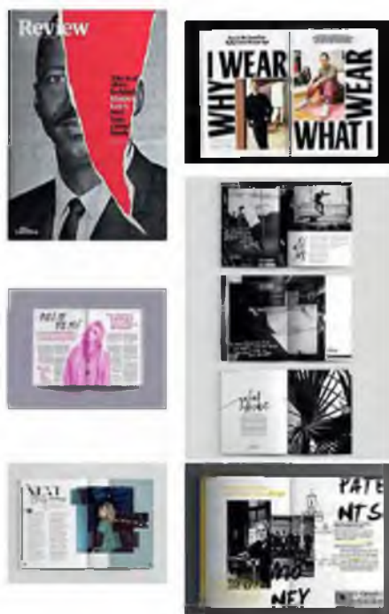
Рисунок 1 – Мудборд

Задача мудборда – не рассказать о дизайне, а показать его в картинках. Но какой-то короткий слоган может быть полезен: для лучшего понимания идеи или просто для демонстрации типографики (рис.1).