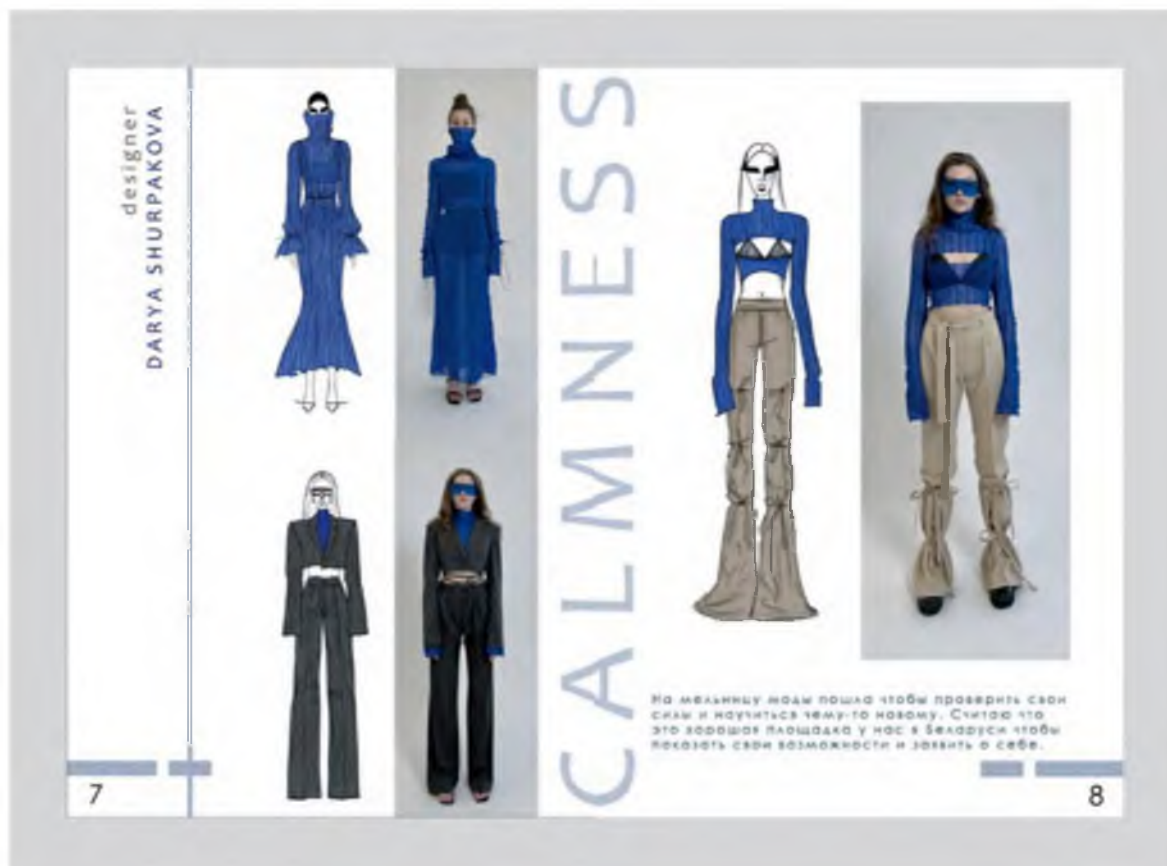
Рисунок 3 – Концепция верстки полосы журнала «Мельница моды»