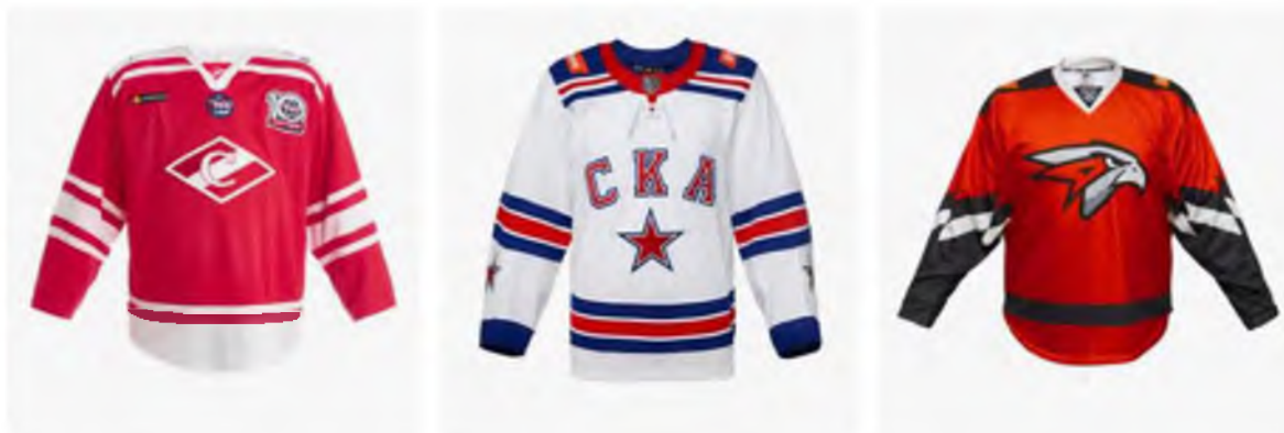
Рисунок 1 – Хоккейная форма Джерси

Важную роль в этом сыграли как минимум два фактора: растущая популярность национальных спортивных лиг (баскетбольной NBA, хоккейной NHL, бейсбольной MLB) и стиль заметных представителей рэп-индустрии (рис. 1).