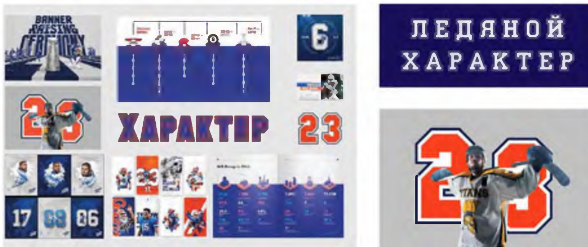
Рисунок 2 – Дизайн-разработка для концепции 1

В разработке первой концепции так же использован объемный дизайн с применением 3d-графики. Объемная графика может быть применена в дизайне таймлайна (рис. 2).