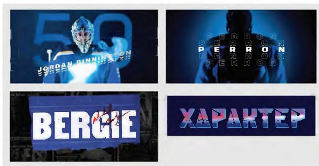
Рисунок 4 – Дизайн-разработка для концепции 3

Идея третьей концепции – исследование о самом виде спорта, хоккее. Изучив все составляющие и элементы, появилась идея о том, чтобы в данном варианте показать разрез от конька, который остается на льду, после того, как хоккеист рассекает коньками по льду (рис. 4).