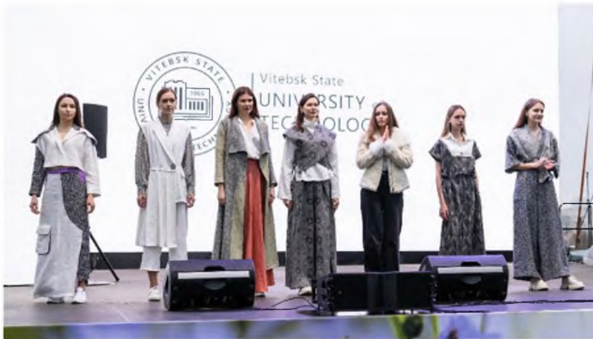
Рисунок 4 – Коллекция «Альянс». Фестиваль «Свята льну. Роднае моднае» (г. Минск)

тонов. Растительные и геометрические орнаменты сохраняют свою актуальность. Современные и исторические мотивы двух культур удивительным образом соприкасаются между собой. Главный признак коллекции – асимметрия кроя основных деталей каждой модели созвучная симметрии сдержанных силуэтных форм. Введение одного из лидирующих элементов конструктивно-декоративного характера, такого как крупные складки, является определённой новизной проекта. При этом ассортимент многообразен – летнее пальто, жилеты, жакеты, комбинезон, брюки, юбки. Структурная составляющая используемых тканей, согласно рисунку 1, повлияла на совокупность признаков промышленных изделий из льна, способствующих единству концептуального решения развития коллекции (рис. 4). По результатам конкурса студенты 3 и 4 курсов специальности «Дизайн костюма и тканей» награждены сертификатами «За развитие льняной отрасли и продвижение бренда «Белорусский лен».