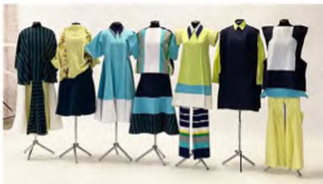
Рисунок 1 – Предложенные образы для съемки

На основе данных официального сайта института PANTONE проанализированы актуальные цветовые палитры на будущий сезон. Обзор тенденций выявил наиболее предпочтительные колористические