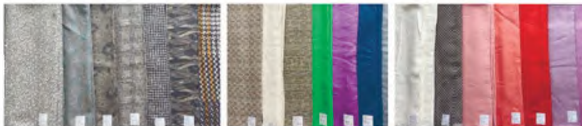
Рисунок 1 – Ассортимент материалов для реализации стартап-проекта

Тема устойчивой моды активно развивается согласно кафедральной научно-исследовательской работе «Организация пространственной среды и территориальный брендинг (г. Витебск)». В согласии двух существующих тем по брендингу и развитию стартап-проекта отражаются вопросы по изучению методов исследования и анализу особенностей процесса проектирования студенческих коллекций. Идентификация основных проблем базируется на методах анализа брендинга в Беларуси и странах СНГ. Поиск образного решения, создание эскизов современных моделей, разработка их конструкций направлены на исследование вопросов по подготовке молодых специалистов. В рамках внутривузовского стартап-проекта РУПТП «Оршанский льнокомбинат» предоставил безвозмездную помощь в виде 71,7 погонного метра льняных тканей жаккардовых и гладкокрашенных структурных поверхностей. Возможность использования натурального сырья актуализирует данный проект с точки зрения понятия устойчивой моды. Сырьевой состав указанных материалов экологичен, имеет исключительно натуральные волокна: жаккардовые ткани – 51 % хлопок, 49 % лён; гладкокрашенные ткани – 100 % лён. Ассортимент тканей для коллекций представлен на рисунке 1.