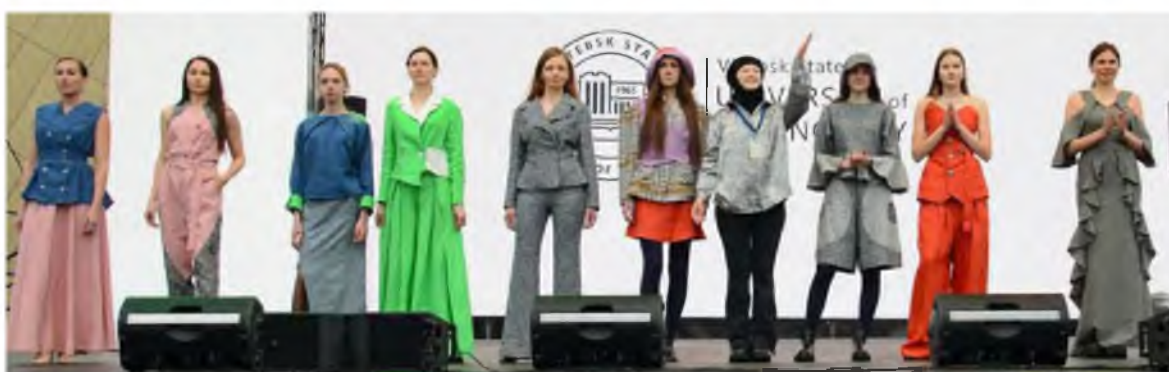
Рисунок 3 – Коллекция «Здесь и сейчас». Фестиваль «Свята льну. Роднае моднае» (г. Минск)

Дизайн-проект студентов 3 курса специализации «Дизайн швейных изделий» под девизом «Здесь и сейчас» – это вариант осознания костюмного и платьельного ассортимента повседневного назначения. По своей конструктивной сложности авторы предлагают разнообразие модных элементов, пропорциональных между собой, в традиционном понимании изделий из льна. Коллекция построена на контрастах чётких линий и мягких форм, где геометрия заимствована из современных архитектурных источников, объединяющих в себе как выразительность строгих силуэтов, так и пластичность декоративных деталей. Сочетание признаков административного стиля чередуется с признаками романтизма. Ассортиментный ряд включает: платья и жакеты, юбки и блузки, жилеты и корсеты, а также брюки «клёш» и «палаццо». Композиционным акцентом является введение травянисто-зелёного, олицетворяющего молодость, красоту и свежесть. Классика и льняные ткани органично сочетаются друг с другом. Дизайн студенческих моделей позволяет сохранить функциональные качества изделий наряду с актуальными трендами, диктующими моду (рис. 3).