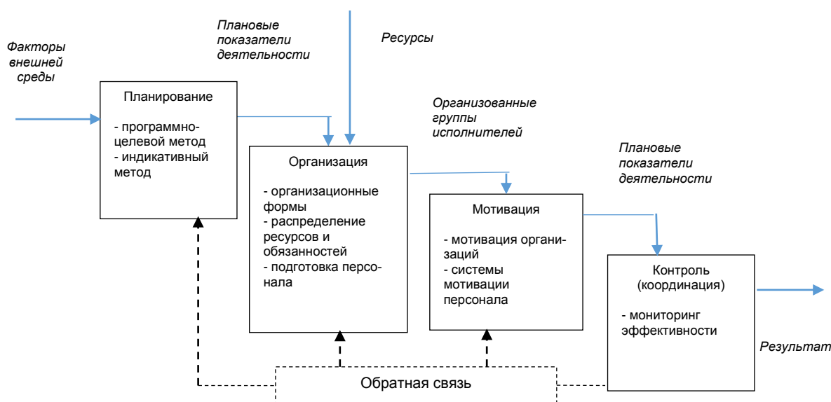
Рисунок 1 – Основные элементы механизма управления

Адаптация термина «механизм» в теории управления означает порядок действий, реализацию методов и приемов, обуславливающих воздействие субъекта управления на объект управления. При этом подход, характерный к определению «экономического» механизма, в рамках которого импульс приводит в действие некоторые сложившиеся естественным образом отношения, модифицируется, поскольку механизм управления может состоять из нескольких методов управления, формирующих сигнал к изменению состояния объекта управления. Применение данных методов может быть реализовано как последовательно, так и комплексно [1]. На рисунке 1 представлены основные элементы механизма управления.