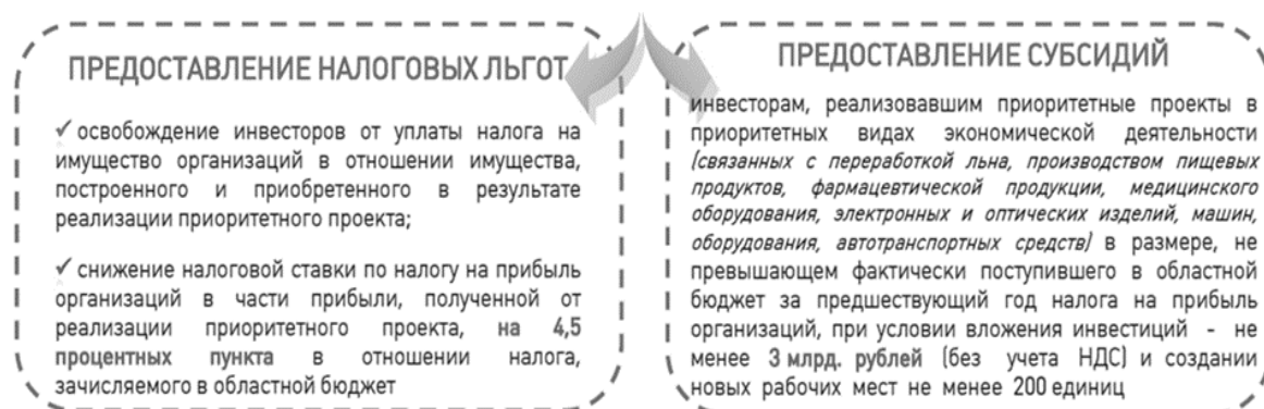
Рисунок 2 – Механизмы и инструменты привлечения и поддержки инвесторов

На территории Смоленской области действует система мер государственной поддержки, направленная на оказание содействия предприятиям и стимулирование инвестиционных процессов. Все механизмы и инструменты привлечения и поддержки инвесторов, закрепленные региональным инвестиционным законодательством, востребованы и активно применяются бизнес-партнерами. При этом процедуры оказания поддержки максимально упрощены, носят заявительный характер, что обеспечивает максимально эффективное взаимодействие власти и бизнеса. Государственная поддержка оказывается как приоритетным, так и одобренным инвестиционным проектам Смоленского региона.