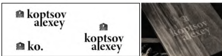
Рис. 4. Логотип фирменный штамп для третьей концепции «Koptsov Alexey»

В третьей концепции акцент завязан на бренде имени. Изобразительная часть логотипа совмещает в себе идею домашнего уюта, идею мастерской и удобных и экологических вещей и содержит в себе идею скандинавского дизайна (рис. 4).