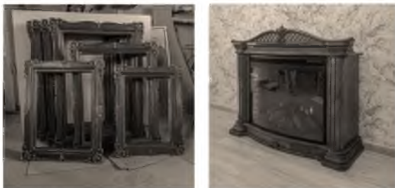
Рис.1. Пример выполненных изделий в мастерской заказчика