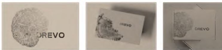
Рис.3. Логотип, визитка, упаковка второй концепции

Вторая концепция имеет название «DREVO» – отсылка к идеи силы, роскоши, богатства, классики, «на века». Используется рубленный, без засечек шрифт, который играет дополняющую роль к основной графике (рис. 3). За основу был взят шрифт «Synparate Curg».