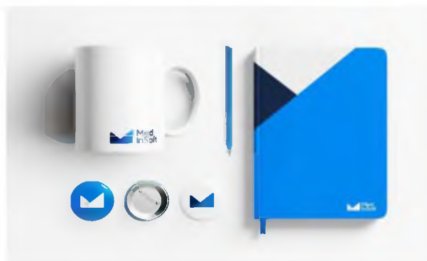
Рис. 3. Сувенирная продукция для IT-компании «MedInSoft»

В рамках проекта, разработаны носители сувенирной продукции. Она, как носитель фирменного стиля, эффективный способ вызвать интерес к компании. Обязательными элементами сувенирной продукции является наличие логотипа, использование фирменных шрифтов, элементов общей верстки. Подарки для руководства компаний-партнеров, как правило, подчеркивают деловой характер взаимоотношений, что позволит поддерживать связь с инвесторами, потому крайне популярны в качестве сувениров ежедневники, органайзеры, дорогие шариковые и перьевые ручки и прочие vip-сувениры. Сувениры же, рассчитанные на массового клиента, обычно заказываются в больших объемах, а потому отличаются универсальностью (такой презент как ручка или блокнот будет приятен любому) и экономичностью (выбирается бюджетные модель и способ нанесения). Сувенирная продукция оказывает положительное влияние для привлечения. Характеризуется низкой стоимостью контакта, по сравнению со средствами массовой информации. Повышает уровень доверия и побуждает к последующему обращению к бренду (рис. 3).