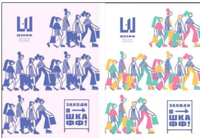
Рис. 3. Плакаты с авторскими иллюстрациями для магазина женской одежды «Шкафф»

Основные тенденции в графическом дизайне, которые послужили вдохновением при создании логотипа и рекламно-информационной поддержки стали причудливые персонажи, плоские иллюстрации, негативное пространство и минимализм.