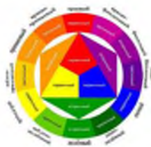
Рисунок 1 – Цветовой круг Иттена

Круг Иттена разделен на 12 цветовых секторов. Всего содержится 3 основных первичных цвета – это синий, желтый, красный. Именно при их смешивании и получается всё многообразие цветового круга. Следующие цвета цветового круга носят название составные или вторичного порядка, их тоже 3 – это фиолетовый, оранжевый и зелёный. Эти цвета получаются путём смешивания в равном соотношении цветов первого порядка. Благодаря смешиванию цветов первичного и вторичного порядка получают 6 цветов третичного порядка [3].