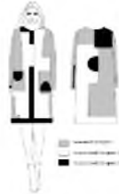
Рисунок 2 – Эскиз модели пальто женского

С учетом разработанных рекомендаций, на основе анализа моделей-аналогов и направления моды на предстоящий сезон, разработана серия моделей женских демисезонных пальто в стиле колор-блок. Модели разработаны с использованием принципа типового проектирования – на одной базовой конструктивной основе прямого силуэта, втачного покроя. Разнообразие моделей достигается использованием цветовых сочетаний по принципу классической триады. Членения деталей пальто на геометрические фигуры остается неизменным. Технический эскиз модели пальто женского представлен на рис. 2.