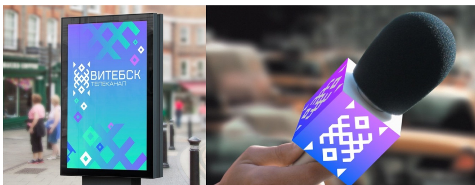
Рисунок 2 – Фирменные составляющие для телеканала «Витебск»

Кроме основных необходимых составляющих, айдентика телеканала включает также фирменные майки, ручки, кружки, флешки, кубики на микрофон, папки и многое другое. Ни один крупный бренд в настоящее время не обходится без наружной рекламы. Использование наружной рекламы для телеканала обеспечит компании узнаваемость и запоминаемость, повысит статусность, привлечет внимание потенциальных партнеров и зрительской аудитории. Для телеканала были разработаны наиболее популярные и самые эффективные форматы наружной рекламы: биллборд, сити-формат и рекламный плакат (рисунок 2).