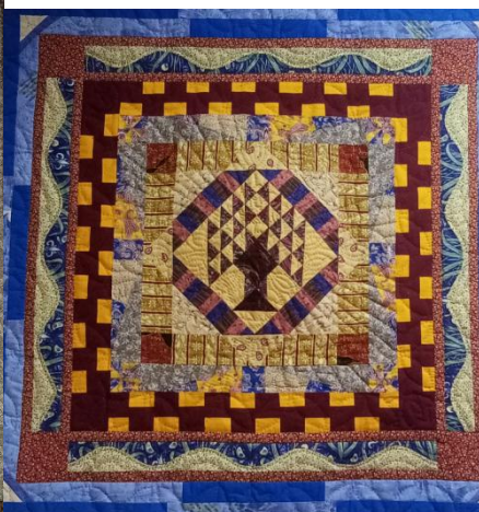
Проект «Мир без границ»