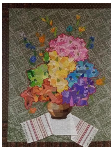
Визитная карточка Центра ремесел и национальных культур «Рошва»

Еще одно участие клуба в международном проекте – «Мой Гиньоль» (рис. 2). В данном проекте участвовало 3 страны: Франция (1 работа), Россия (7 работ) и Беларусь (1 работа). Инициатором являлась Франция. Задача – путешествие Гиньоля по приглашению разных стран и городов. В Беларуси Нестерка показывает Гиньолю на воздушном шаре центр Европы – Полоцк.