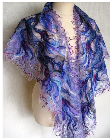
Техника «Крези – вулл»