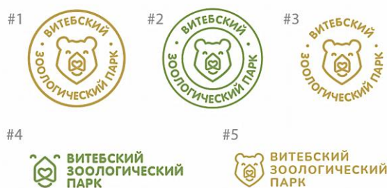
Рисунок 1 – Поисковые варианты логотипа

При поиске основной концепции для знака было представлено несколько поисковых вариантов (рис. 1).