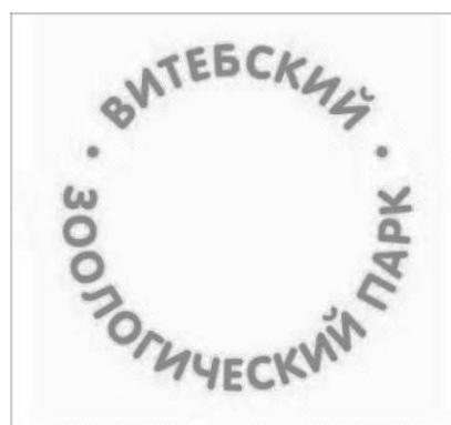
Рисунок 5 – Шрифт, используемый в логотипе

Итогом процесса проектирования стал логотип, который соответствует современным графическим тенденциям и рекомендациям: придерживаться минимализма, упрощённости, абстрактности (рис. 6).