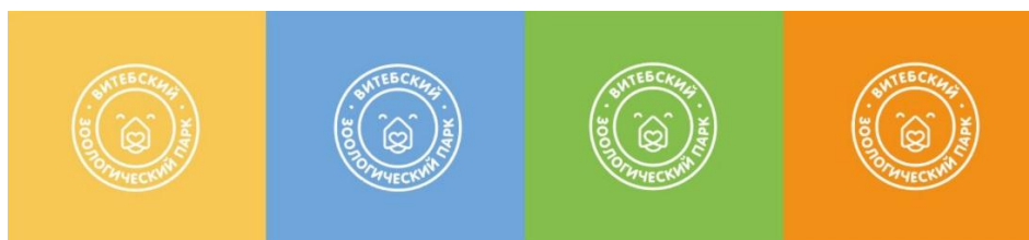
Рисунок 4 – Варианты использования логотипа

Основное колористическое решение линейного логотипа – это использование солнечно-жёлтого или желтовато-зелёного цветов. Использование логотипа возможно также на ярких подложках дополнительных цветов (рис. 4). Такой вариант будет хорошо смотреться на фирменной сувенирной продукции для зоопарка.