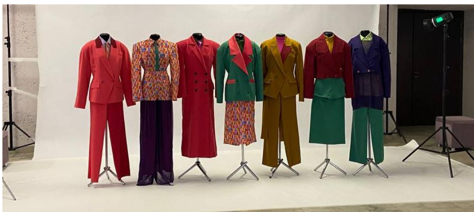
Рисунок 4 – Коллекция женской одежды в классическом стиле (дизайнер – Анна Трохимец)

Коллекция предназначена для женской молодежной аудитории в возрасте от 18 до 25 лет (рис. 4).