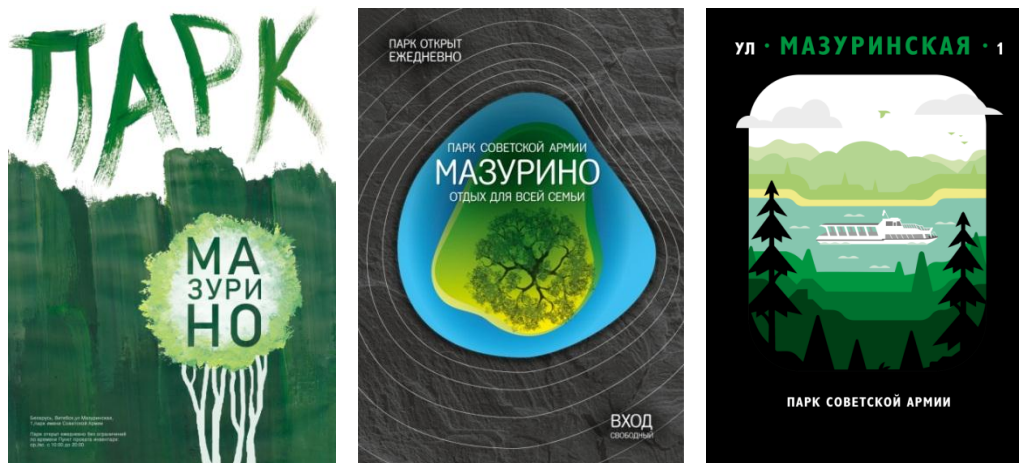
Рисунок 3 – Концепции плакатов с использованием природных и экологических элементов для парка культуры и отдыха г. Витебска

Концепции плакатов для парка культуры и отдыха г. Витебска (рис. 3).