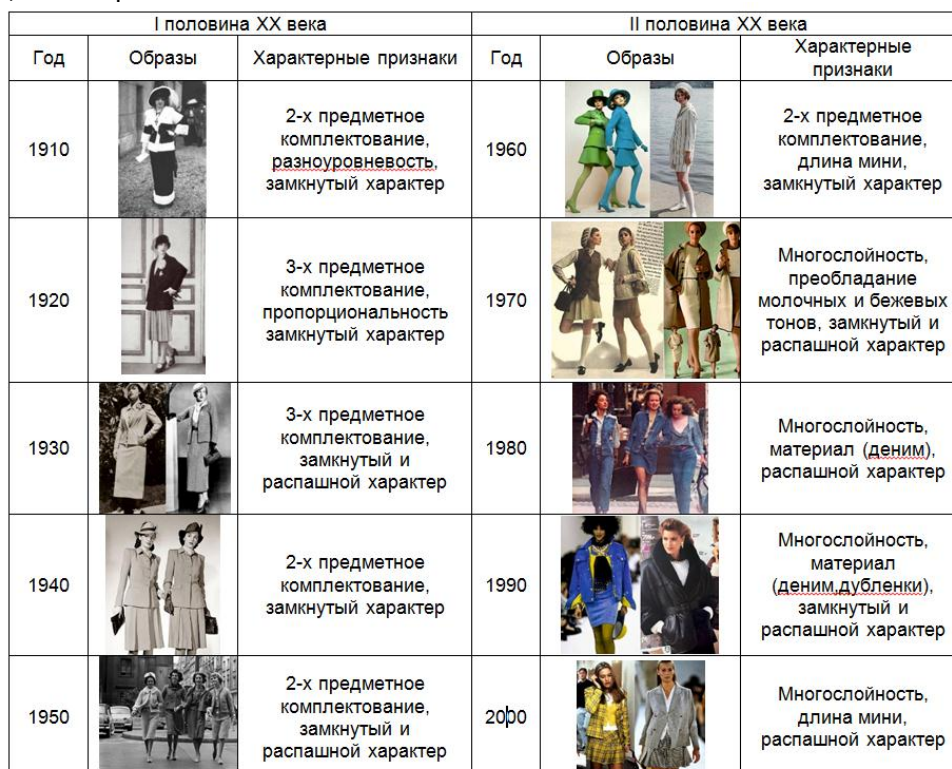
Таблица 1 – Образы комплектов XX века

В процессе исторического анализа была создана авторская схема, представленная на рисунке 1.