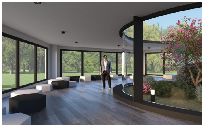
Рисунок 5 – Территория между 2 и 5 УЛК. Фрагмент павильона кампуса.