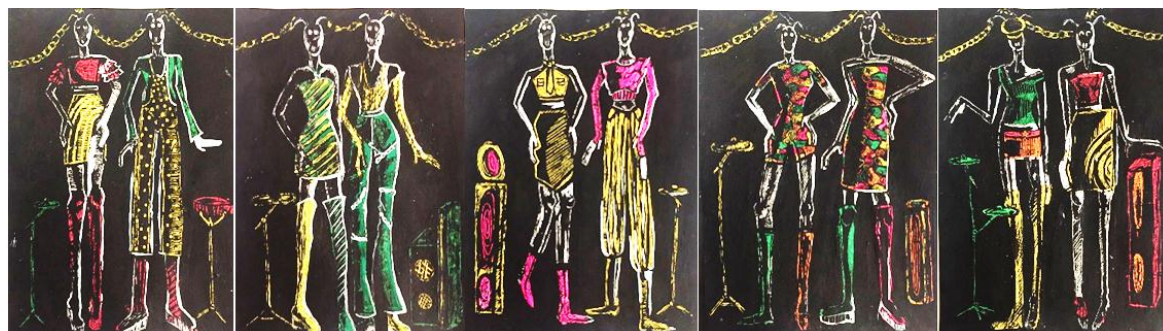
Рисунок 2 – Модели молодежной одежды в стиле «grunge» (автор Шалагинова Я.Э.)

Выявленные закономерности развития моды использованы при разработке коллекции молодежной одежды в стиле grunge (рис. 2). Базовыми элементами стали типичные для гранжа «рваные» вещи, кепки и цепи [7]. В разработанной коллекции использованы различные элементы стиля гранж, рассмотрена ассоциирующаяся с grunge клетчатая юбка со складчатой поверхностью [8]. Широко применено сочетание мужского и женского стилей: это и различные классического покроя костюмы в необычных цветовых решениях, включая тонкую полоску, как отсылку к галстучной ткани. Галстуки используются как самостоятельный элемент одежды благодаря встраиванию в конструкцию плечевых и поясных изделий. Цветовое решение коллекции передает дерзость и смелость, присущие этому стилю grunge.