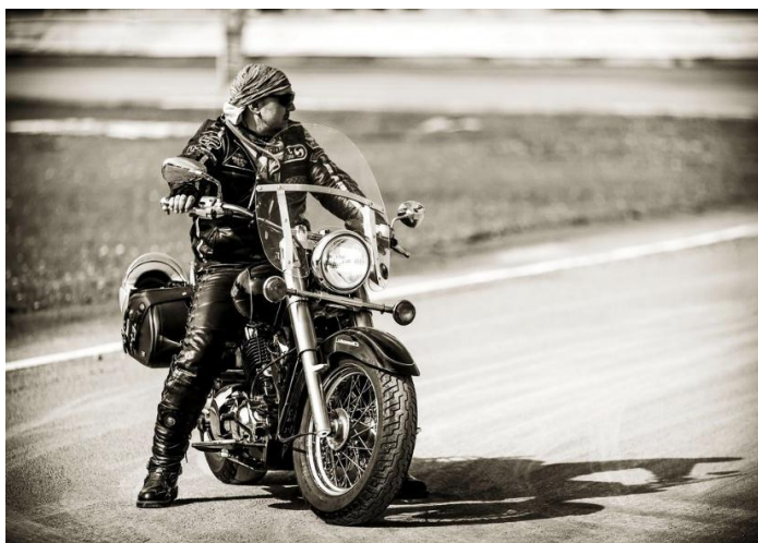
Рисунок 1 – Рокерский стиль байкера

Байкерскую субкультуру в современном мире отличает не только наличие мотоцикла, но и их внешний уникальный стиль, который напрямую зависит от его класса. Например: спортивный стиль соответствует спортбайкам и внедорожным мотоциклам, гаучо и гранж (рокерский) – это класс чоппера, кастома, круизера, городской стиль предпочитают обладатели классических байков, а рабочий разработан специально для служб защиты населения [1,2]. Однако самым запоминающимся и ассоциирующимся с байкером является стиль гранж, иначе рокерский (рис. 1).