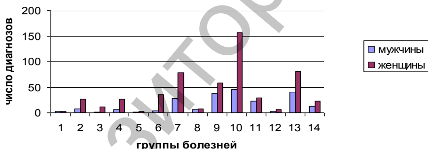
Рис. 2. Соотношение заболеваемости мужчин и женщин в микрорайоне.