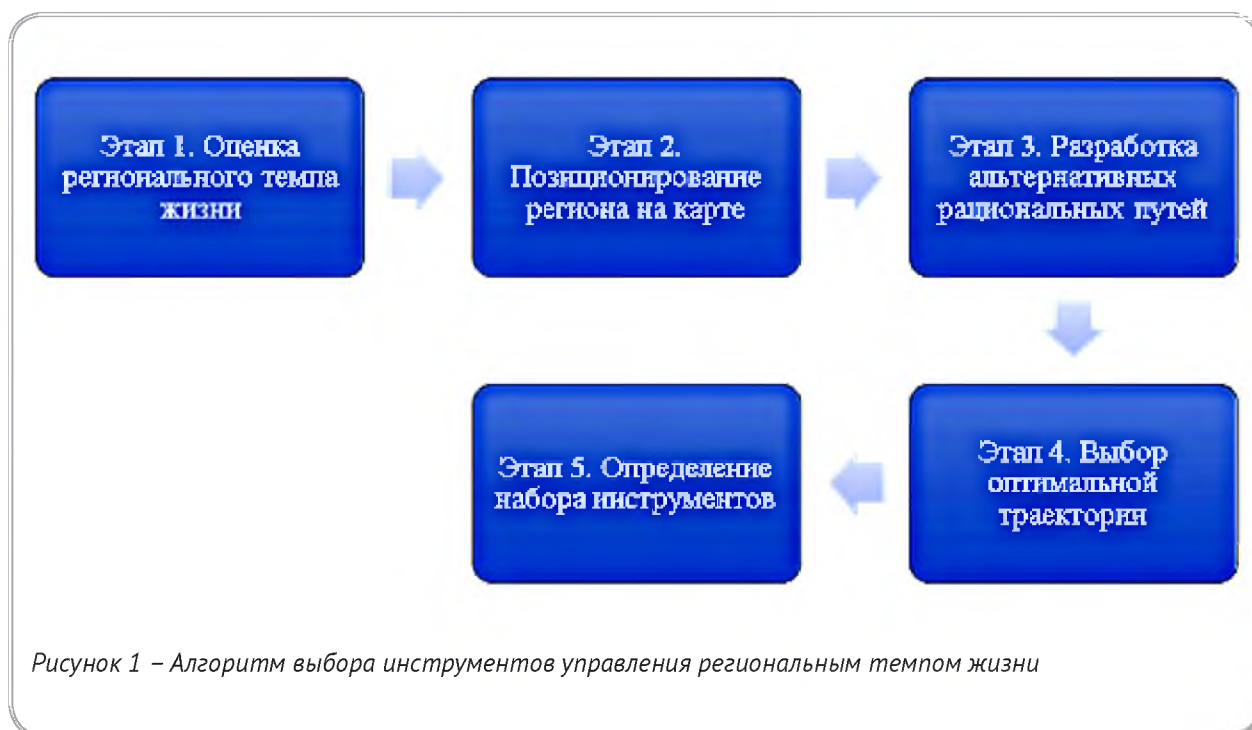
Рисунок 1 – Алгоритм выбора инструментов управления региональным темпом жизни

нального темпа жизни представляет собой интеграцию частных критериев, выделенных из исходного множества показателей интенсивности физического и информационного потоков. Сформированный набор показателей включает: количество пассажирских мест и коек внутрирегионального транспорта в расчете на душу населения; пассажирооборот внутреннего транспорта в расчете на душу населения; количество автотранспорта в расчете на душу населения; доля площади городских земель; плотность дорог на км^2 ; конечное потребление электроэнергии транспортным сектором в расчете на душу населения; доля общей площади застройки; трафик телефонных разговоров в расчете на душу населения; количество аэропортов в расчете на душу населения; конечное потребление электроэнергии в расчете на душу населения; поставки моторного топлива в расчете на душу населения; трафик дорожного движения; доля населения с ежедневным выходом в интернет; конечное потребление электроэнергии в жилых домах в расчете на душу населения; количество мобильных абонентов в расчете на душу населения; количество телефонных линий в расчете на душу населения; количество интернет-пользователей в расчете на душу населения; доля лиц исполь-