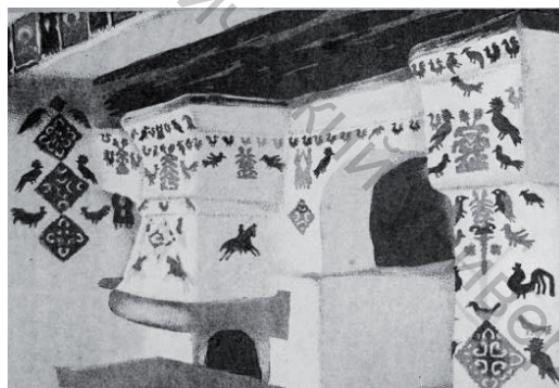
Рисунок 4 – Вытинанка в интерьере украинского сельского жилья

Украшения эти невелики и, как правило, узкими лентами тянутся вдоль стен. Наклеенный на белой стене узор, составленный из небольших цветных вытинанок, смотрелся будто нарисованный. На однотонной белой стене наклеивались вытинанки синие, красные, желтые, зеленые, черные - а иногда и золотые, которые составляли гармоничные узоры, играли богатством красок, тянулись цветистыми гардинами вдоль стен, вокруг окон, оживляя монотонность сельского жилья. В этом и заключается главная особенность