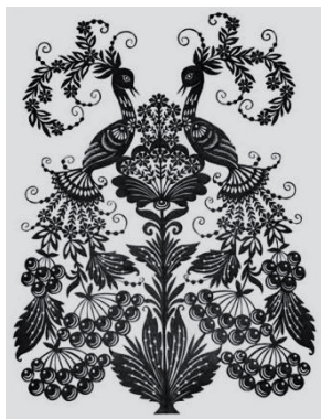
Рисунок 3 – Современная украинская вытинанка. Зяткина Ирина

Белые стены сельской хаты любили украшать бумажными вытинанками. Вокруг икон, окон, под мысыком (полка для посуды), вдоль сволака (центральная балка на потолке) наклеивали взоры (украшения) из мелких бумажных вытинанок, которые, будто вышивка на белой сорочке, стелились на белой стене. Каждая вытинанка представляла собой законченное украшение, но одновременно она являлась составной частью всего декора, который, будучи наклеен на стене, замещал настенные росписи.