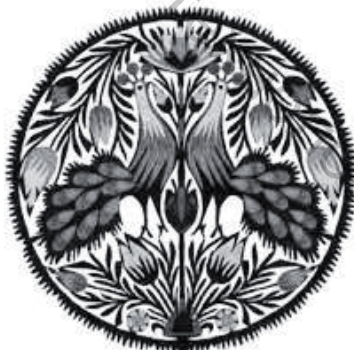
Рисунок 5 – Польская выклеянка

Разновидностью вытинанок являются выклеянки – многоцветные декоративные формы, созданные из отдельных частей, наклеенных друг на друга или друг около друга.