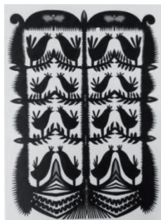
Рисунок 1 – Использование мотива «птицы» в вытинанке. Вячеслав Дубинка

Для Беларуси свойственна зеркальная симметрия в искусстве вырезания из бумаги. В основном композиции представляют собой ярко выраженную вертикальность, на основе которой строятся традиционные мотивы «Дрэва жыцця», «Кветак - вазонаў» и «Кустоў», известные в качестве, вышивке, росписи.