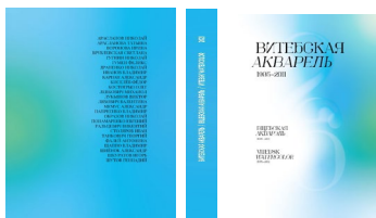
Рис. 5. Обложка альбома

Первое впечатление от художественного альбома создает ее обложка. Конструктивно обложка такого же размера, как и книжный блок с использованием мелованной бумаги 300 г/м 2 с высокой цветопередачей. Данный выбор позволит при печати обложки применять разнообразные графические эффекты. На обложке использован градиент под обрез основного книжного формата. При создании градиента был использован инструмент «произвольный градиент» в программе Adobe Illustrator (рис. 5).