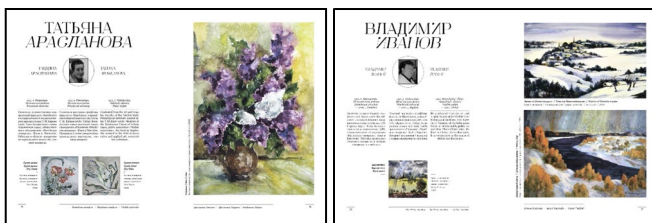
Рис. 2. Стилистическое решение визуального оформления разворотов художественного альбома

В художественном альбоме иллюстрации играют главную роль, но вид текста и текстовых блоков не менее важен для качественного вида всего издания. В структуре альбомного разворота данного проекта есть 3 вида текстовой информации – заголовки, основной текстовый блок, пометки под иллюстрациями. Чтобы их структурировать и разграничить выбраны следующие гарнитуры: SK Zweig Rounded, Playfair Display и Montserrat. Особенности подбора каждой гарнитуры являлось наличие различных начертаний и поддержание английского, русского, белорусского языков.