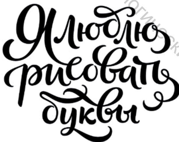
Рисунок 1 - Леттеринг

Леттеринг (lettering) с английского языка дословно переводится, как написание букв, что сближает его с древнейшим искусством каллиграфии. Однако более близким по значению можно считать следующее описание стиля. Леттеринг — это способ рисования буквенных и символьных сочетаний, которые объединены одним стилем и композицией. В результате дизайнер получает уникальный графический рисунок с надписью, выполненной персональным подчерком.