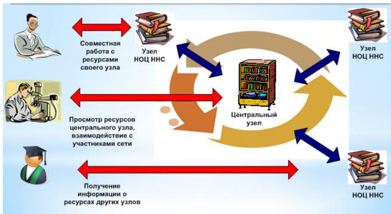
Рисунок 4 – Ориентировочная схема функционирования информационной сети

исходя из системного анализа результатов ежегодных социальных опросов педагогов, обучающихся и специалистов бизнеса. В режиме дистанционного обучения педагогам разных уровней образования должны предоставляться электронные курсы, включающие различные тематические модули, а также интерактивное методическое сопровождение по всем актуальным проблемам педагогического образования через систему видеоконференцсвязи, Skype и т. д. Для этого необходимо создание единого информационного пространства научно-образовательных центров ННС (рис. 4).