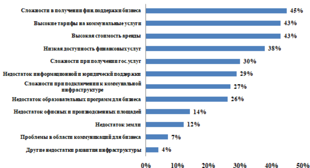
Рисунок 2 – Ткань хлопчатобумажная, кустарная, набивка печатными штампами

26 % бизнесменов поставили вопрос о недостатке образовательных программ для бизнеса и 46 % сложности в получении финансовой поддержки бизнеса. Данные цифры с различным небольшим отклонением повторяются из года в год.