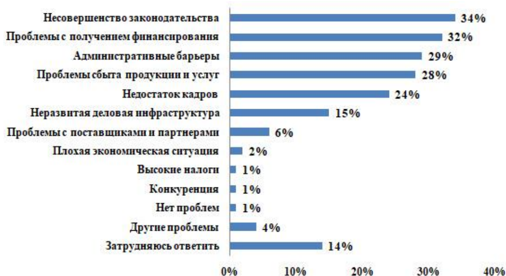
Рисунок 1 – Анализ основных проблем бизнеса

(рис. 1). Данный отчет наделал много шума в муниципальных образованиях и вызвал интерес у бизнеса. Наши отрасли, в которых работает легкая промышленность, на 80 % состоят из предприятий малого и среднего бизнеса.