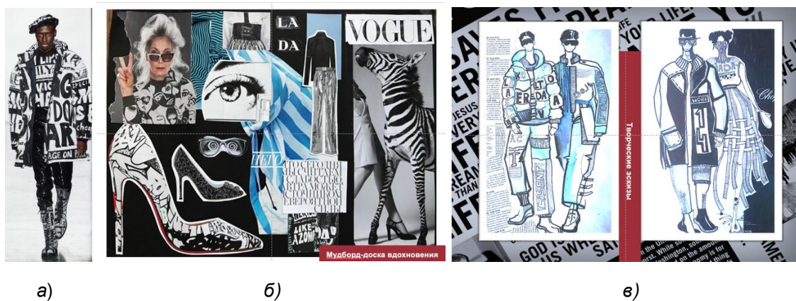
Рисунок 2 – Творческие разработки: а) коллекция Джереми Скотта (2019 г.)–«Пресса»; б) мудборд коллекции; в) эскизы коллекции

Коллекция построена на сочетании контрастных цветов: черных и белых (рис. 2 б) [3]. Используется принцип «позитив и негатив», когда на табличках черного цвета пишутся фразы белым шрифтом и наоборот. В принтах используются различные шрифты, с различной толщиной букв, различным наклоном и размером. В его коллекции шрифтовые прописи изображаются не всегда так, как в газетах и журналах по горизонтали слева направо, часто текст используется в диагональном и хаотичном расположении [4].