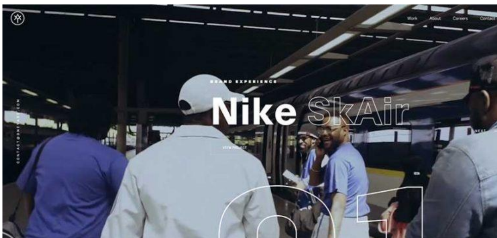
Рисунок 2 – Использование контурного шрифта

Контурные шрифты получили широкое распространение в 2020 году, и ожидается увидеть еще более частое использование их в 2021-м. Эффект прозрачности становится ещё более мощным, когда противопоставляется жирному шрифту рядом (рис. 2).