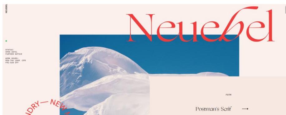
Рисунок 1 – Сайт дизайн-студии Neuebel & Mark. Использование антиквы и гротеска

Обращаясь к актуальным трендам, следует отметить возвращение шрифтов с засечками – антиквы (рис. 1).