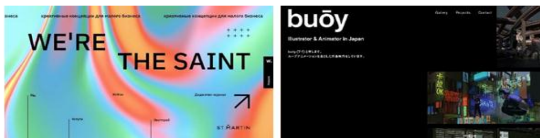
Рисунок 5 – Новый психоделик, Киберпанк и Vaporwave

Новая психоделическая атмосфера – это ретро-возврат к ярким цветам в сочетании с современными нотками. Он основан на психоделических разработках прошлых лет. Психоделик широко использовали в 1970-х – пятьдесят лет назад. Спустя полвека старое снова становится новым. 80-е были началом эпохи цифровых игр и новой волны компьютеров [4]. Направление киберпанк и Vaporwave – это вариации ретро-футуристических дизайнов того времени, ставших сейчас актуальными (рис. 5).