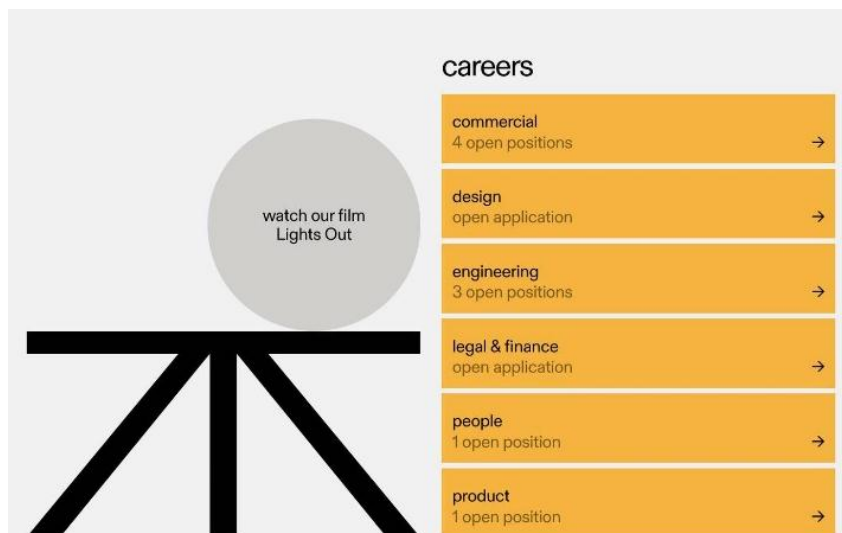
Рисунок 3 – Сайт мобильного приложения REKKI

На фоне минимализма с аккуратной цветовой палитрой, консервативными шрифтами, четкой сеткой и понятным UX внезапно появился хаос. В 2019–2020 годах брутализм становится мейнстримом: в моде «ломаная» сетка, кислотные цвета, нечитабельный текст и всплывающие окна. На первое место встал дизайн сам по себе, а не юзабилити. Тенденция к бруталистскому стилю, вероятней всего, сохранится. Следует отметить, что он стал более мягким и современным, а в палитре доминируют сложные оттенки (рис. 3).