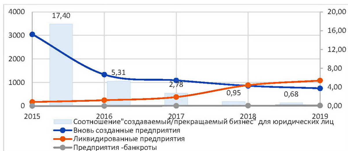
Рисунок 1 – Динамика создания и ликвидации предприятий в Севастополе в 2015–2019 гг.

Банковское обслуживание корпоративных и частных клиентов также существенно осложняется санкциями. Международные платежные системы – Visa, MasterCard, PayPal – прекратили работу в Крыму, а расчеты такими картами, выпущенными материковыми банками, стали возможны только с переводом всех внутрисекторских транзакций Visa и MasterCard на процессинг национальной системы платежных карт. Исключение из системы SWIFT фактически приостановило валютное сопровождение внешнеэкономических операций местными банками. И хотя по большинству позиций банковской системы Севастополь и Крым уже сравнялся со среднероссийскими показателями, полноценной эту систему назвать пока сложно.