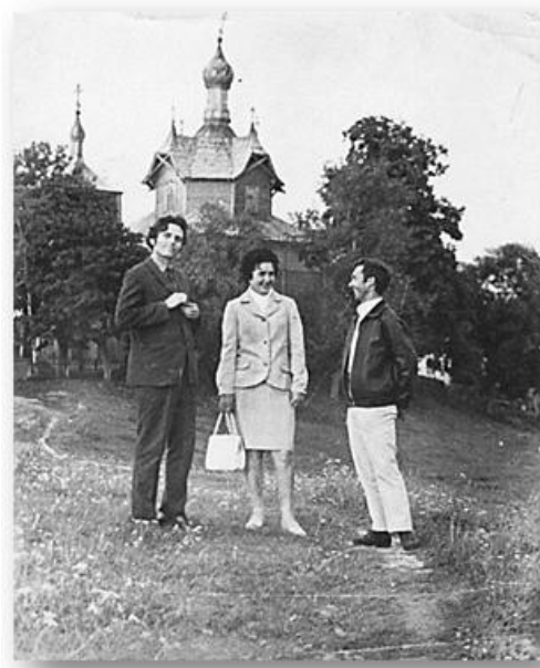
Малюнак 1 – Па Віцебскай вобл. (Шаркаўшчынскі р-н).

кую галіну навукі, як этналогія і антрапалогія, збіраўся матэрыял для эмпірычнага, а затым і аналітычнага ўзроўню даследавання.