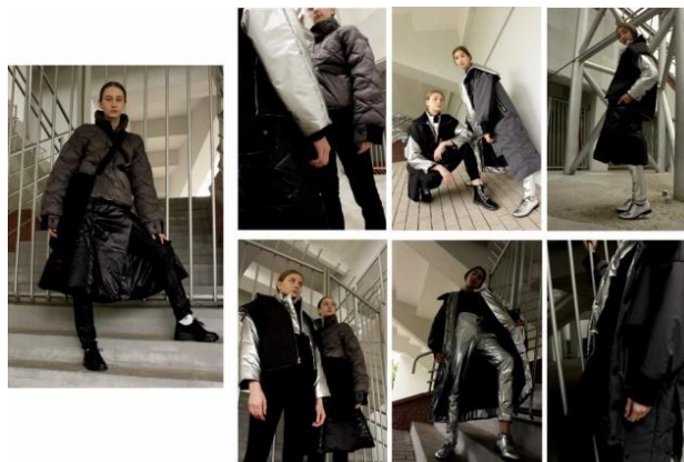
Рисунок 2 – Авторская коллекция в материале

Креативные принципы коллекции – новизна, оригинальность, функциональность, практичность, многослойность, объемность, трансформативность, графичность позволили добиться особых результатов: модели в материале для младшей и средней возрастной группы демонстрировались на выставке произведений молодых художников «Точка росы» (Россия, г. Мурманск); на конкурсе «Мужские куртки 20/21» (г. Минск), подтверждая ценность научной разработки актом внедрения в производство модельной куртки на ЧП Nikolom (г. Минск), и актом внедрения в учебный процесс по специальности «Дизайн костюма и тканей».