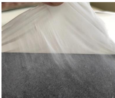
Рисунок 3 – Процесс снятия покрытия с подложки

В результате проведенных исследований установлено, что наиболее рационально осуществлять наработку нановолокнистых материалов из исследованной марки поливинилового спирта при расходе раствора до 1700 мкл/ч, обеспечивая высокую равномерность покрытия и его сохранность при последующем снятии с подложки.