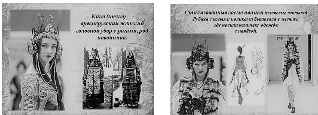
Рисунок 2 – Образы коллекции «Вестницы Макошь», конструктивные элементы, декорированные кружевом

Коллекция «Вестницы Макошь» состоит из шести образов и включает в себя: