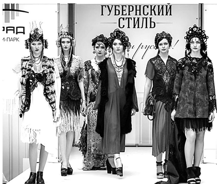
Рисунок 3 – Коллекция «Вестницы Макошь» автор Полищук О.А. (архив кафедры ХМК ТИК РГУ им. А.Н. Косыгина)

В коллекции были совмещены материалы разных фактур и состава: натуральный мех лисы и овчина, шерстяная ткань; кружево выполнено из шерстяных нитей различной толщины и кожи. Коллекция одежды и аксессуаров «Вестницы Макошь» выполнена в современной интерпретации этнического стиля с использованием метода румынского игольного кружева (рис. 3), отмечена дипломами всероссийских и международных конкурсов, что подтверждает актуальность использования в современных коллекциях техник декоративно-прикладного искусства.