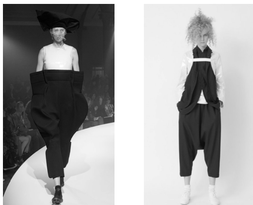
Рисунок 4 – Эмоционально-психологические переживания в качестве творческого источника

Художник-модельер должен смотреть на вещи, явления, окружающие нас, анализируя внутреннюю конструкцию, состояние объекта, чтобы затем суметь трансформировать, видоизменить, упростить, сделать более удобным, наконец, создать новый, авторский образец [1].