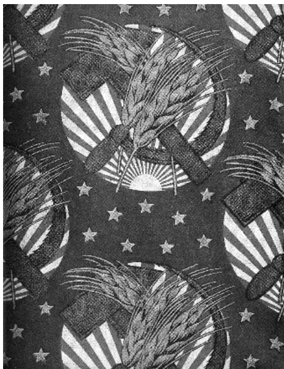
Рисунок 3 – Текстильный орнамент для ткани Трехгорной мануфактуры