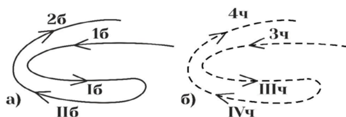
Рисунок 2 – Последовательность прокладывания утков для ткани двойной ширины: 4 утка первого цвета прокладываются: в верхнем полотне (1 б), в нижнем полотне (I б), в нижнем полотне (II б), в верхнем полотне (2 б); 4 утка второго цвета прокладываются: в верхнем полотне (3 ч), в нижнем полотне (III ч), в нижнем полотне (IV ч), верхнем полотне (4 ч)

При разработке последовательности прокладывания челноков для получения ткани двойной ширины необходимо было исключить переход утка с верхнего полотна в нижнее и наоборот при смене цвета. Иначе это приводило бы к соединению полотен, что не допустимо для ткани двойной ширины. На рисунке 2 представлена разработанная последовательность, позволившая увеличить ширину ткани в два раза по сравнению с заправочной шириной станка.