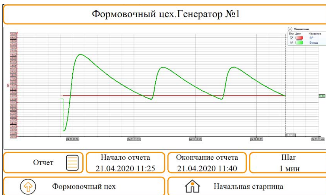
Рисунок 3 – Суточный тренд по каналу «Формовочный цех. Генератор № 1»

Для реализации выборки режима формирования суточного отчёта написан скрипт на языке ST. Он предназначен для создания отчёта: автоматического или ручного. Скрипт программы представлен ниже: